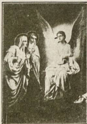
"Jo čia nėra, nes prisikėlė, kaip buvo sakęs."

Šios pridedamosios Velykų apeigos yra labai reikšmingos, gražios ir palai-kytinos visose mūsų bažnyčiose. Mes švenčiame Velykas taip, kaip mūsų bociiai prieš 300 ar 600 metų jas švęsdavo.