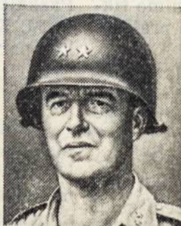
Major General William F. Dean, Berkeley, Calif.—Medal of Honor