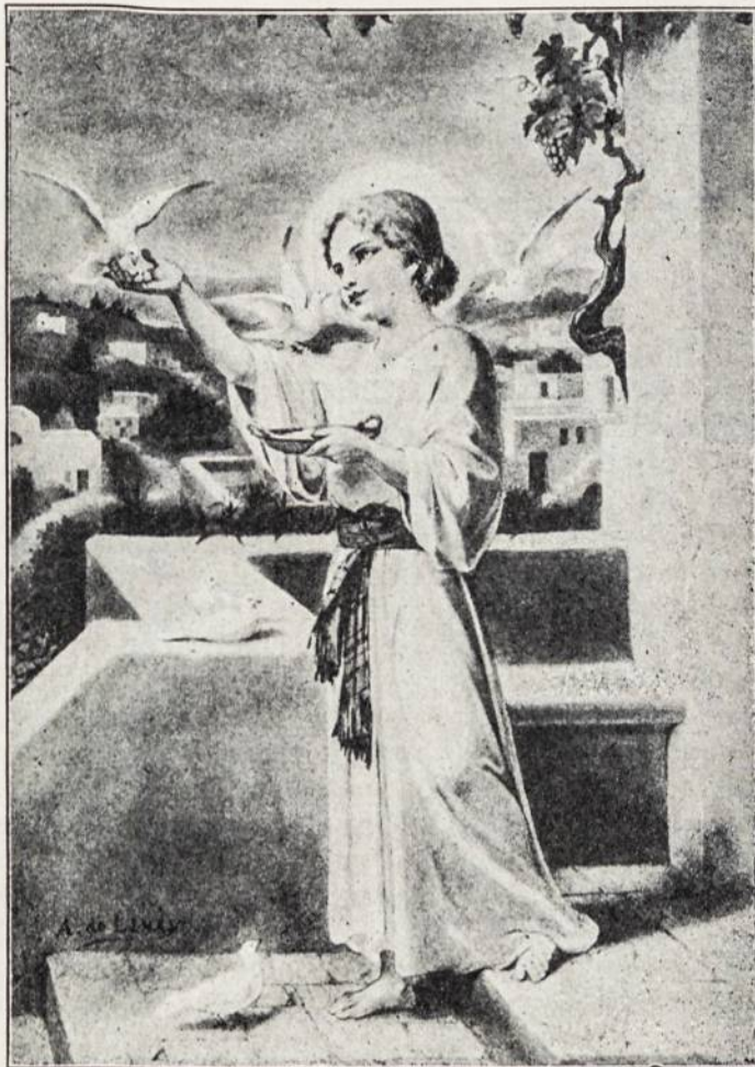
Kristus, būdamas jaunas berniukas, maitina balandžius.

Pirmas Dievo Motinos pasirodymas toje ilgoje pasirodymų eilėje daugiau kaip šimtmečio bėgy buvo 1830 metais