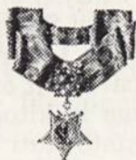
Lieutenant Colonel Raymond G. Davis, USMC Medal of Honor

C OLD, BATTLE-WEARY, the Marines were re-deploying toward Hungnam. A rifle company was guarding a mountain pass vital to the withdrawal of two regiments. The company became surrounded. If help didn't come, 6,000 men were lost.