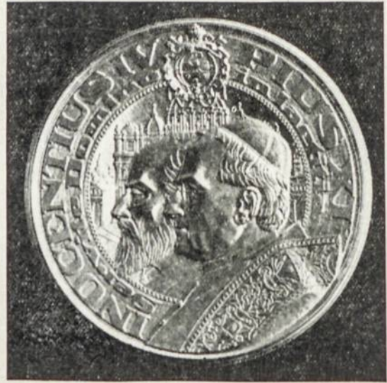
Medaljonai atminčiai įsteigimo Pirmosios Žemaičių vyskupijos ir Pirmosios Lietuvos Bažnytinės Provincijos