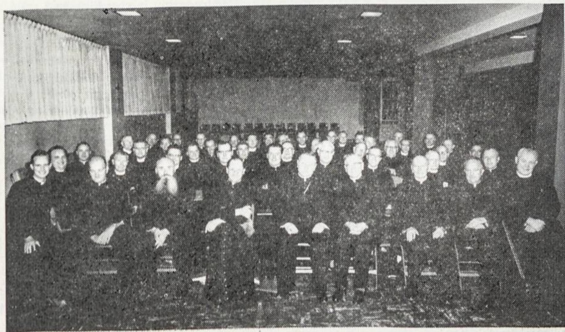
Chicagoj įvykusio Kunigų Vienybės seimo dalyviai