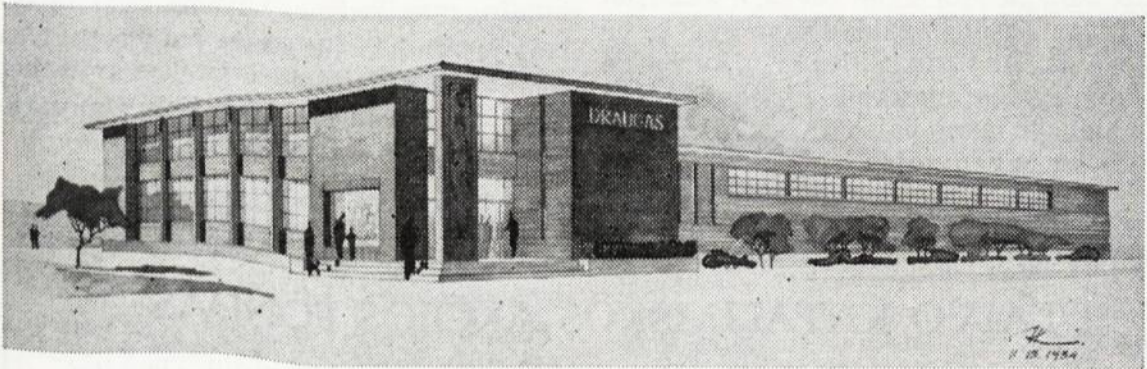
Naujo Draugo Spaudos Centro piešinys

Tėvų Marijonų Bendradarbių Draugijos Savaitraštis