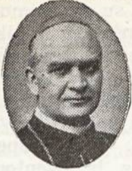
DIEVO TARNAS Arkivyskupas Jurgis Matulevičius