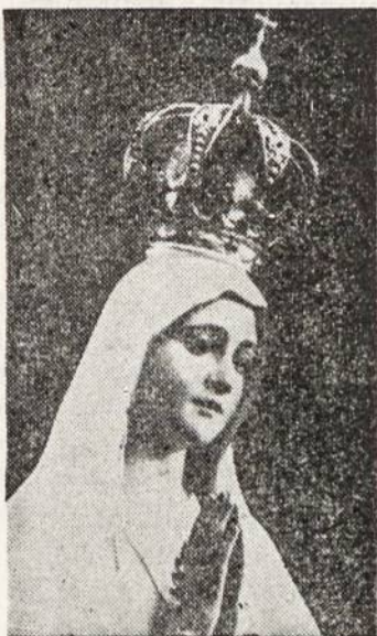
FATIMOS PANELE SVČ.