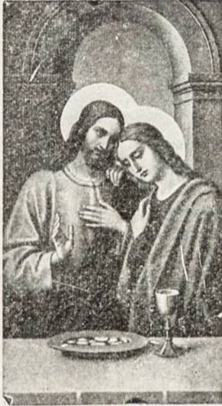
VIESPATS IR SV. JONAS

N UO SENŲ senovės žinoma yra patarlė: ką tik darai, daryk protin-gai ir žvelk į pabaigą. — Žvelk į pabaigą, vadinasi, neprikibk prie vieno mirksnio, bet žiūrėk, kas bus toliau, ypač pačiame gale. Apskritai, žmonės vadovaujasi savo gyvenime čia pareikštąja išmintimi. Sakysime, ūkininkas pavasarį ir vasarą nevaikščioja po laukus grožėdamasis gamta, bet įtempęs jėgas prakituoja, nes žino, kad ateis darganuotas ruduo ir šalta žiema, kada teks misti pavasario ir vasaros darbų vaisiais. Jaunystėje sten-