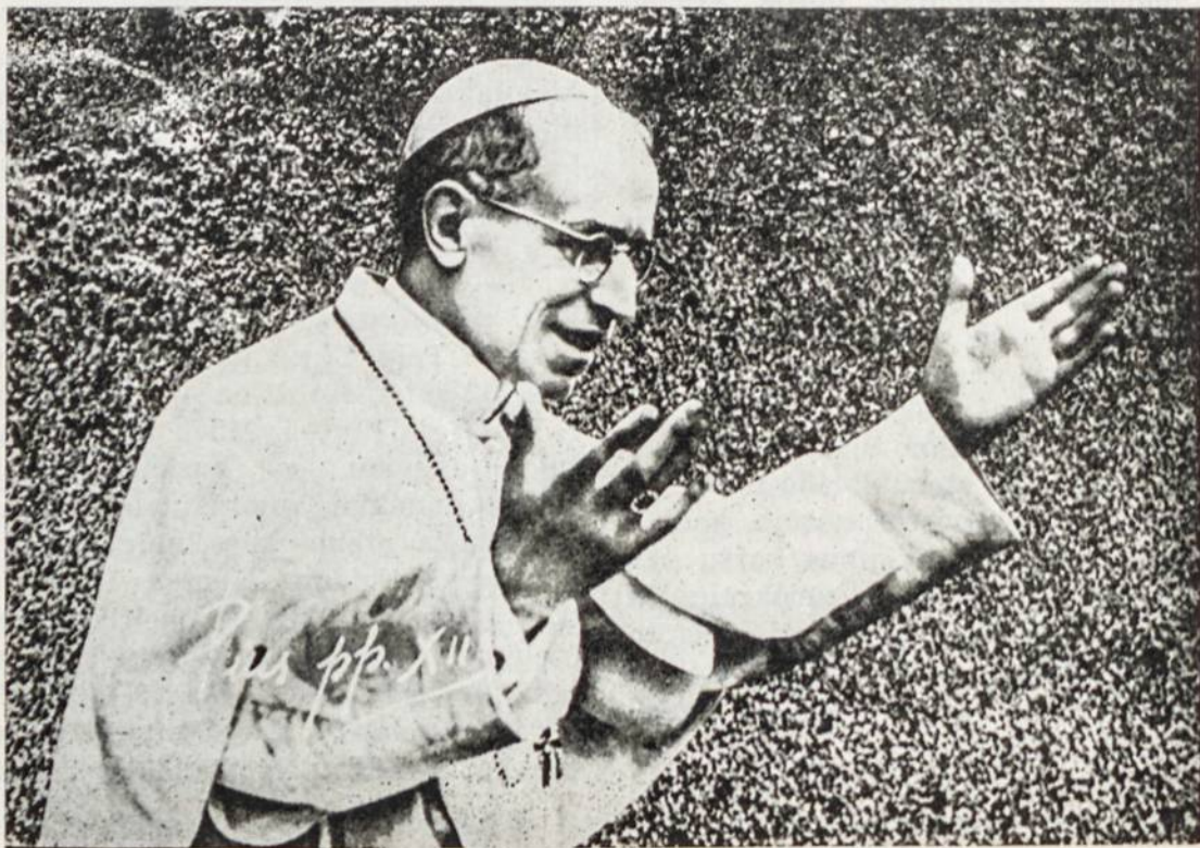
Šv. Tėvas yra persekiojamosios Bažnyčios neklystantis vadas. Jam rūpi viso pasaulio tikintieji.

Šiandien su nuostabumu galime žvelgti į tuos praeities pavojingus laikus ir su džiaugsmu konstatuoti Kristaus mokslo tyrumą, pilnumą ir autentiškumą, kuri mums išsaugojo ir perdavė neklaidingoji Kristaus Bažnyčia. Prisimenant, kiek šaunių karalysčių sugriuvo, kiek galingų valdovų nugrimzdo užmaršties bedugnėje, kiek klaidingų filosofų susikompromitavo, kiek bedievybės pranašų energijos vėjais nuėjo — mumyse kyla šventas pasididžiavimas, didi pagarba, pilna ištikimybė, šventa meilė mūsų Motinai Bažnyčiai, kuri yra šventa, tikra ir neklaidinga ir kuri mums atstovauja patį Jėzų Kristų.