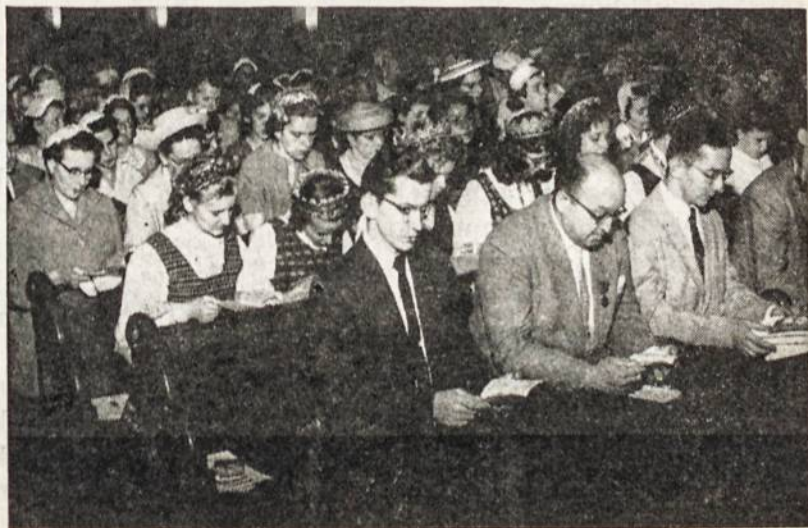
Lietuviai meldžiasi Sopulingo-sios Dievo Motinos Bazilikoje š. m. birželio 27 d.

Portugalijos sosto įpėdinis kuni-gaikštis Ferdinandas, patekęs prancū-zams į belaisvę ir žinodamas savo kali-nimo sunkumus, drebėjo, tartum jį kas