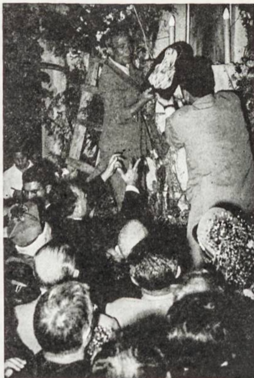
Ašarojančios Marijos atvaizdas iš privačios vietovės perkeliamas į laikinąją šventovę

Garsieji Marijos apsireiškimai tapo akstinu karštesnio jos garbinimo. Nesuskaitomos minios praėjo pro tų garsiųjų šventovių vietas ir kiekvienas ten gavo ir gauna dvasinio atsigaivinimo. Yra parašyta daug knygų apie tas šven-