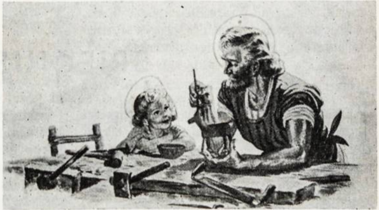
Jėzus mokosi savo švento globėjo amatą

Ir istorija sako, kad Aleksandras atsitolindamas galvojo, jog jis mieliau būtų Diogenu, negu didžiuoju valdovu Aleksandru. Jį paveikė Diogeno pavyzdys, nes tas žmogus, gyvendamas dide-