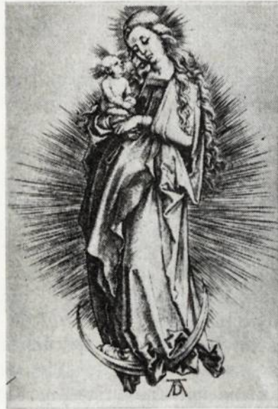
A. Durer'o Vokiška madona

Tame pačiame Hudsono slėnyje yra ir Maryknoll , misionierių centras. Nors ši vieta neturi šventovės vardo, vienok ją kasmet aplanko 50,000 žmonių. Ši