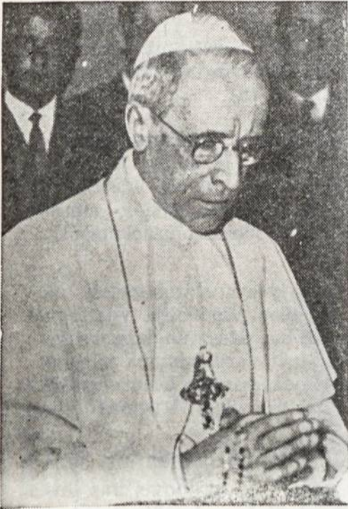
Šv. Tėvas Pijus XII kalba rožančių.

• Mirė Taikos Popiežius. Popiežius Pijus XII mirė Spalio 8 d., 9:52 val. vakare Chicagos laiku. Mirtis sekė po kraujo išsiliejimo 7:30 val. ryto, antrą kartą 48 valandų laikotarpyje. Pirmas smūgis jį dalinai paralyžavo, nors vieną kartą sveikata buvo pagerėjusi: galėjo kalbėti ir valgyti. Jis neteko sąmonės