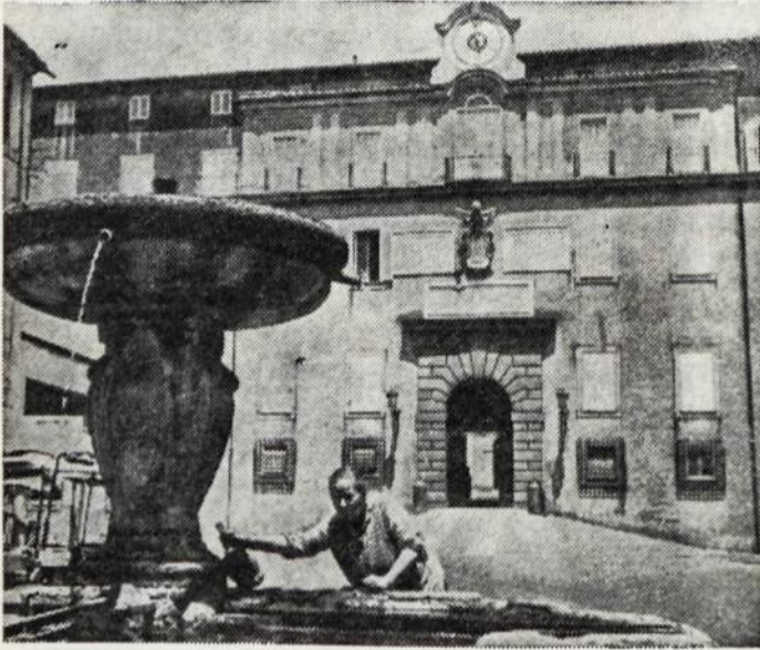
Vasarinė Pijaus XII vila, kurioje Jis mirė

Su didele širdgėla ir nuoširdžiomis maldomis visas pasaulis palydėjo Kristaus Vietininko žemėje sielą į amžinybę. Guodžia viltis jį matyti altorių garbėje. Mirė angeliškas ganytojas. Jis mirė šventumo dvelkime.