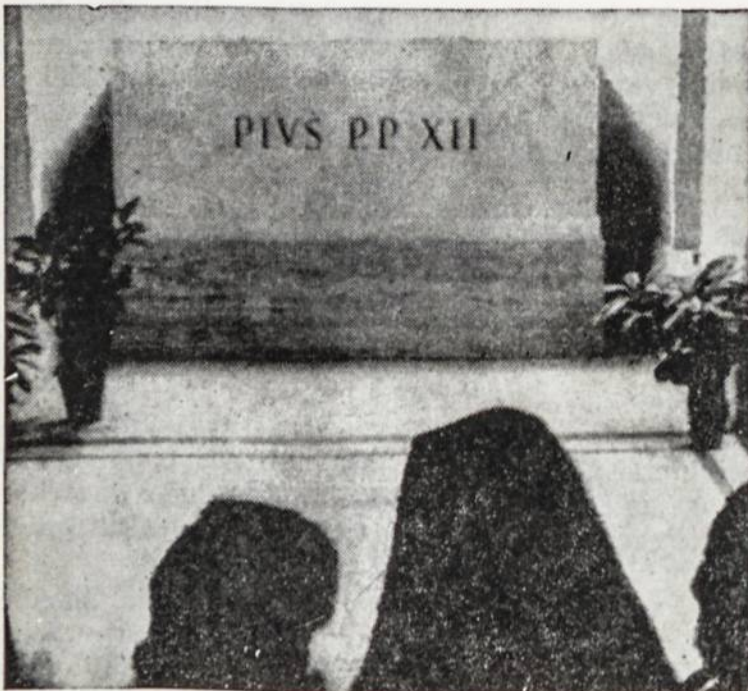
Pijaus XII kapas

"Gerai žinome, kiek daug bandymų turi iškęsti jūsų brangi Tėvynė, — kalbėjo tada Pijus XII lietuvių atstovams. — Žinome, kaip skaudžiai kenčia jūsų persekiojami broliai, kaip negailestingai naikinamos jūsų krašto krikščioniškos tradicijos. Dėl to mes prašome Dievą visiems ištvermės ir laiminame jūsų kenčiančią Tėvynę, laiminame visus jums brangius asmenis, o ypatingai tuos, kurie Tėvynėje ar ištrėmime labiausiai kenčia, nes juo labiau kas kenčia, juo yra mums brangesnis".