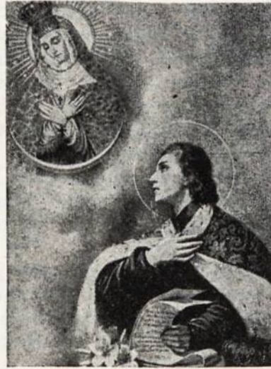
Šv. Kazimierai, melskis už mus ir kankinamą Lietuvą!

pasakyti nors žodį už Kristų, ateikite gi čia ir pasakykite.