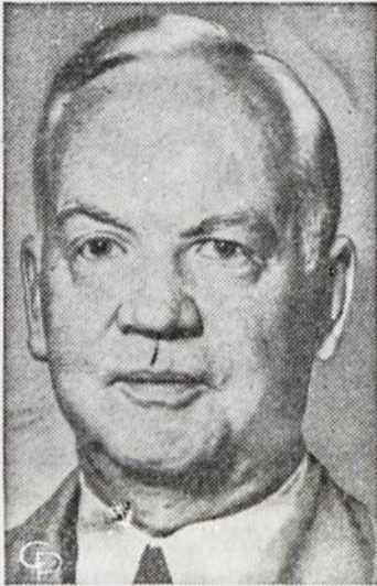
Naujas Vokietijos prezidentas

• Vokietijos prezidentu liepos 1 d. išrinktas Henrikas Luebke, 64 metų, katalikas, krikščionių demokratų partijos narys, buvęs vakarų Vokietijos žemės ūkio ministeris.