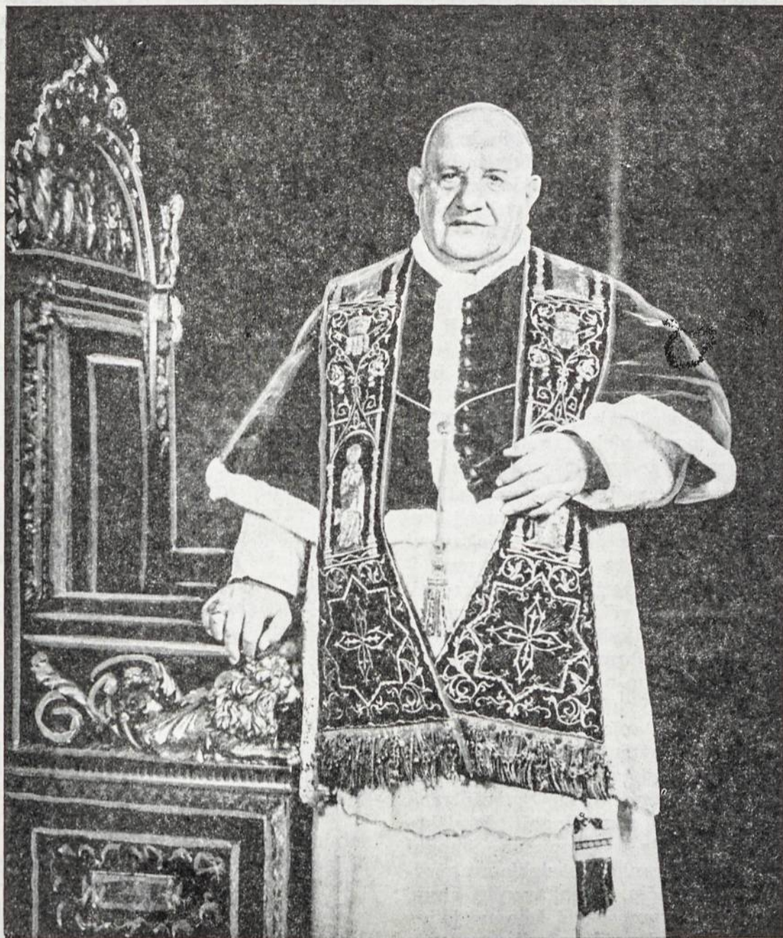
Jo Šventenybē Popiežius Jonas XXIII