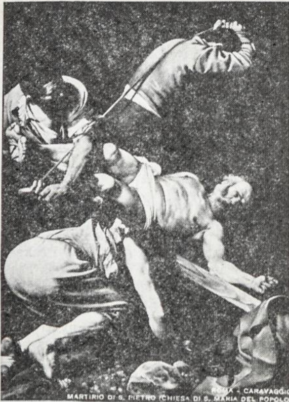
Šv. Petro nukankinimas Caravaggio Rup. 1 d. minima: šv. Petras kalėjime.

metus Romoj, šv. Prakseda tuoj po mirties ėmė garsėti stebuklais.