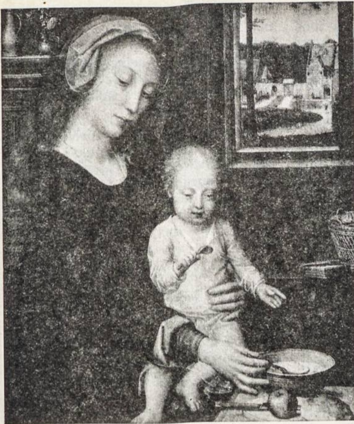
Šv. Marija su Kūdikiu G. David Briuselio meno muzėjuje

mena, jog yra naudos ausims iš to, kad netoli jų yra akys, kad kojoms padeda rankos ir kad visų įvairiai veikiančių sąnarių sutartis yra labai gera Dievo duotoji žmogui dovana. Apaštalas moko, kad taip pat yra įvairumo Bažnyčioje, kad tas įvairumas yra iš Dievo ir kad ta įvairumo sutartis sudaro Bažnyčios panašumą į Kristaus Kūną, kuriame taip pat buvo įvairių sąnarių vieningai veikiančios sutarties.