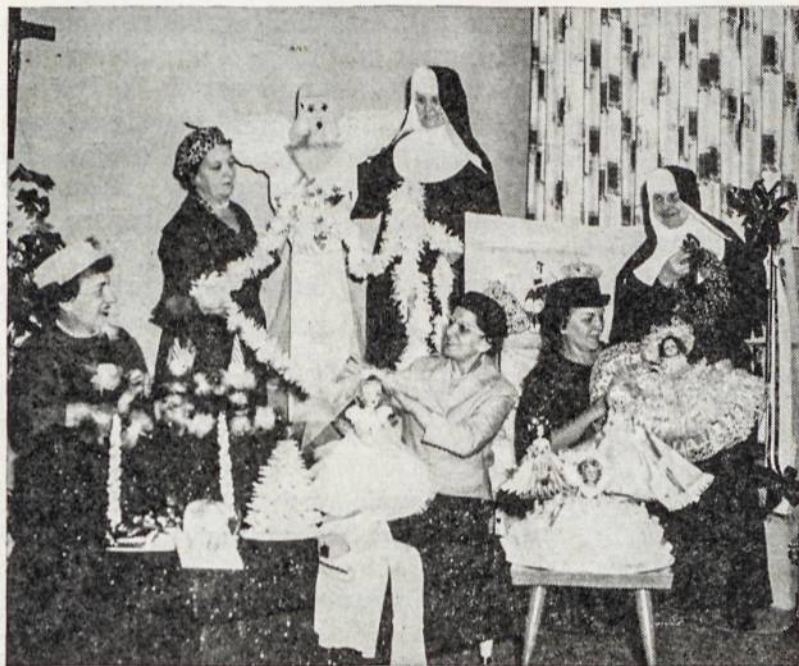
Marijos Aukšt. Mokyklos Motinų klubo pasiruošimas prieškalėdiniam parengimui Chicagoje. Talkina seselės Kazimierietės.

Ir tik tada jį atpažinau, baisiai surikdamas: Viešpatie, tai aš esu! Padėjai man surasti mano prakaito lašus, padėk man surasti tuos turtus, kuriuos tėvai man tikrai paliko.