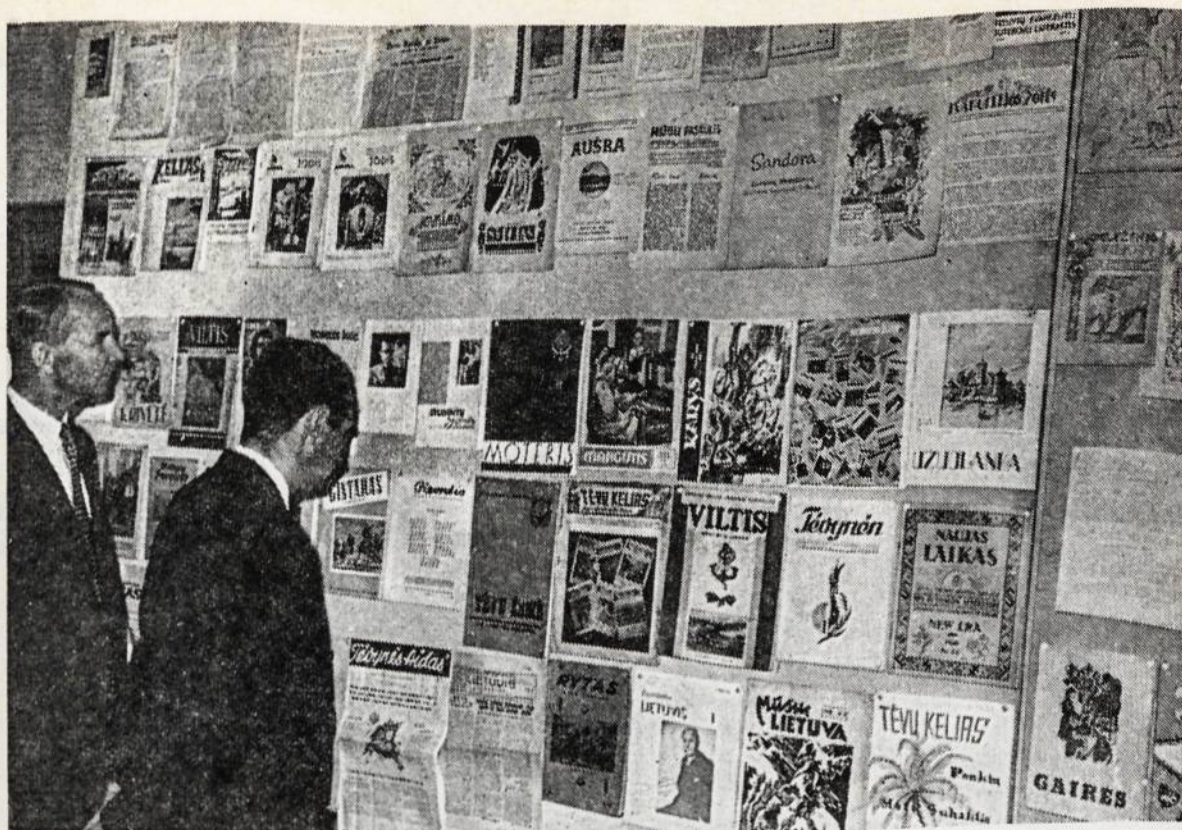
Lietuvių spaudos parodoj, Chicago, Ill. vieni iš įdomiausių pavyzdžių buvo įvairūs lietuviški laikraščiai. Čia buvo galima matyti beveik visus išėivijoje leistuosius ar leidžiamus lietuviškus laikraščius.