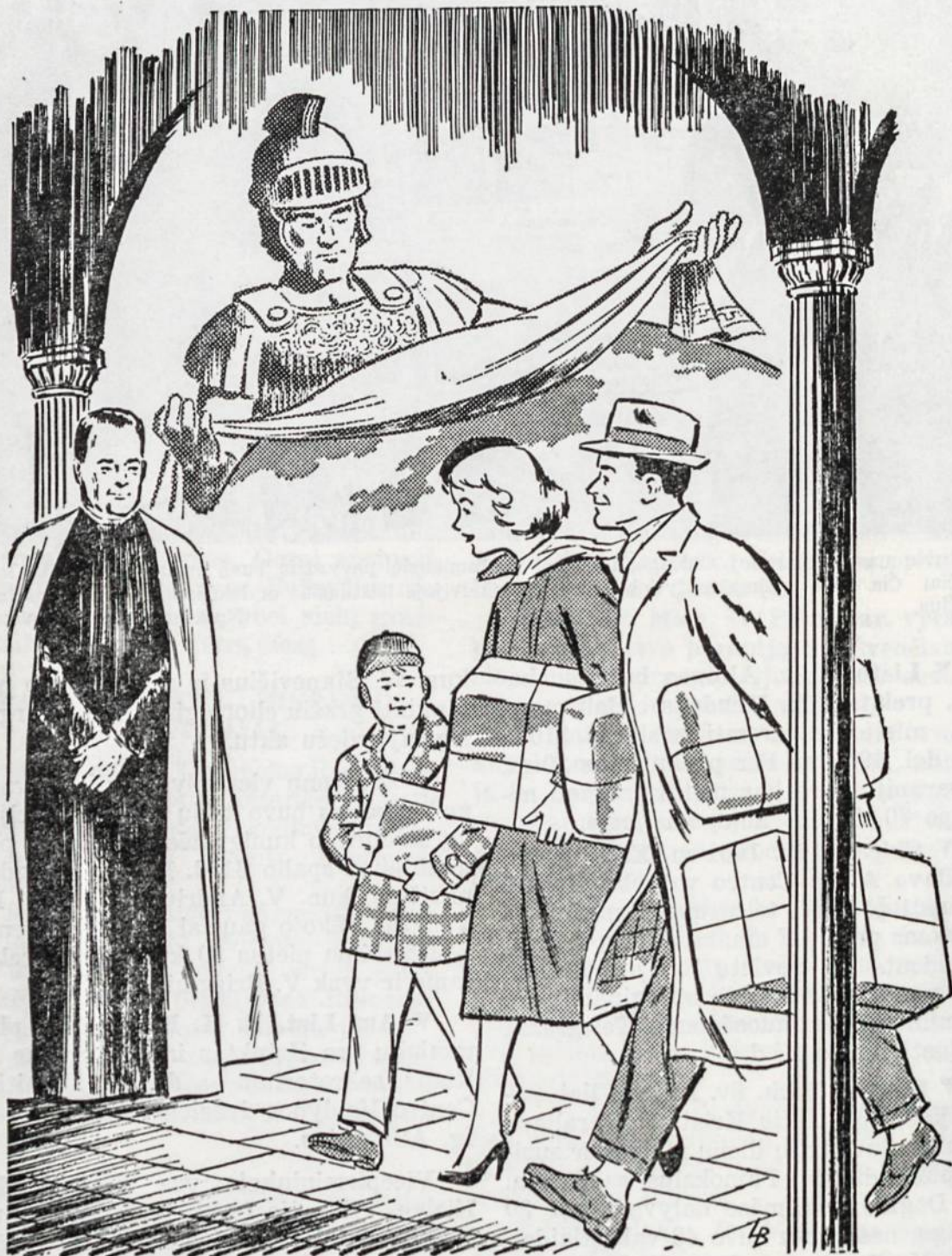
JAV katalikų 16,500 parapijose vyksta padėvėtų rūbų rinkliava. 1961 m. lapkr. 19 - 26 d.