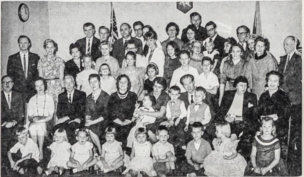
Los Angeles, Calif. vyresnieji ateitininkai su jau nu atžalynu, susirinkę Lietuvių namuose.