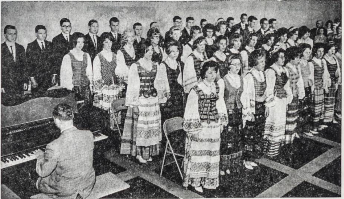
Čikagos Aukšt. Lit. mokyklos abiturientų vienuoliktoji laida. Mokslo baigimo iškilmės. Abiturientai dainuoja Maironio "Užtrauksim naują giesmę".