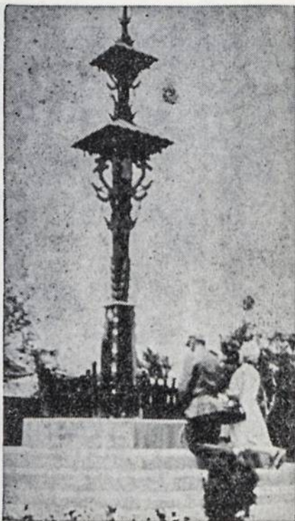
Lietuviškas kryžius — kopyltstulpis pasaulinėje New Yorke parodoje

Paviljone irgi yra graži koplyčia antrame aukšte, kur kasdien laikomos šv. mišios ir ypatingos pamaldos. Yra ir daug kitų įdomių dalykų, bet reikėtų daug daugiau vietos ir laiko visus tuos dalykus aprašyti. Reik tik tiek pasakyti, kad kiekvienas katalikas tikrai gali didžiulis ta paroda. Ji duoda mūsų Bažnyčiai daug garbės. Nė vienas katalikas nesigaili, kad jis praeitais metais aukojo jos išlaikymui.