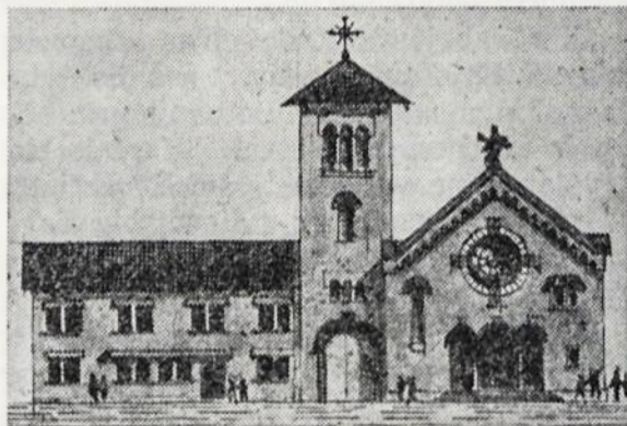
Marijonų Aušros Vartų bažnyčia Avellanedoje prie Buenos Aires, Argentinoje