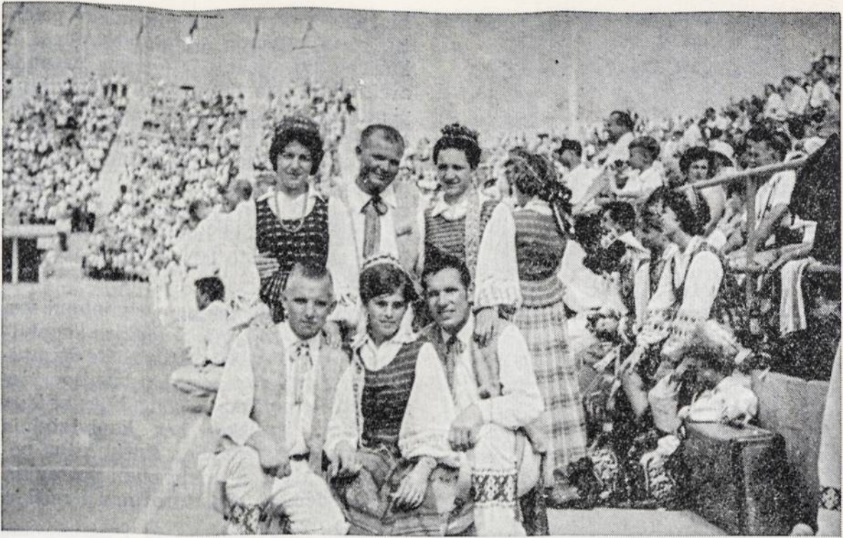
Chicagos lietuvių jaunimas Lietuvių dienoje New Yorke rugpiūčio 23 d.