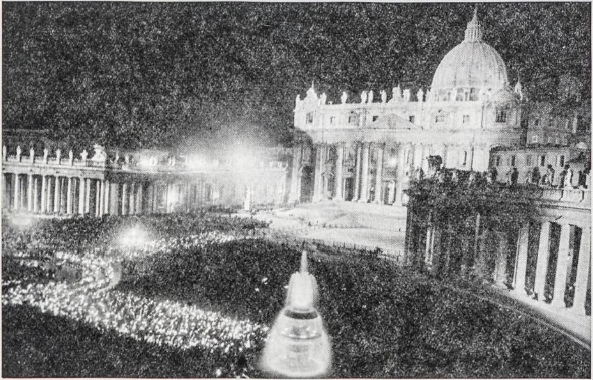
Šv. Petro bazilika ir aikštė Vatikane pirmąjį vis. Bažnyčios susirinkimo atidarymo vakarą 1962 m. spalio 11 d. Viduryje jaunimas su fakeliais.