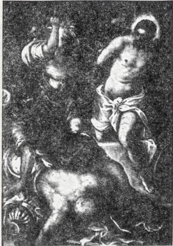
Tintoretto — Kristus prie stulpo

Tuo metu Antverpeno mieste gyveno pirklys Anastras. Subankrutavęs savo prekyboje, sumanė pasinaudoti karaliaus skirta suma ir nužudyti kunigaikštį Vilhelmą. Kadangi pats asmeniškai neišdrįso to padaryti, tai ieškojo budelio, kuriam skyrė gerą atlyginimą. Pasisiūlė jaunas 19 metų prancūzas Jauregui. Jis norėjo padėti pirkliui Anastrui, pas kurį buvo tarnavęs. Kai viskas buvo suorganizuota ir sutarta, Anastras, kad nekiltų prieš jį įtarimas, išvyko iš Antverpeno. O Jauregui, apimtas baimės ir netikrumo, nuvyko pas Antverpeno ispanų kapelioną domininkoną Temmermanną. Tai buvo 1582 m. kovo