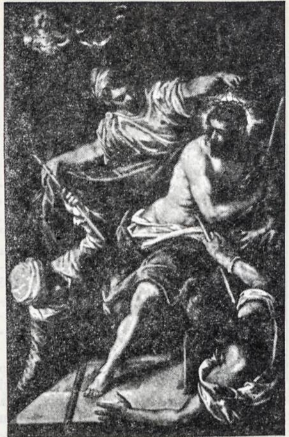
Tintoretto — Kristus apvainikuotas erškėčiais

Aš dar ir šiandien tebematau aną ilgai nepastebėtą kryžių.