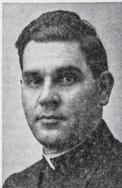
A. a. kun. A. Mažukna, MIC

A. a. kun. Antano dar liko gyva motina, du broliai ir sesuo.