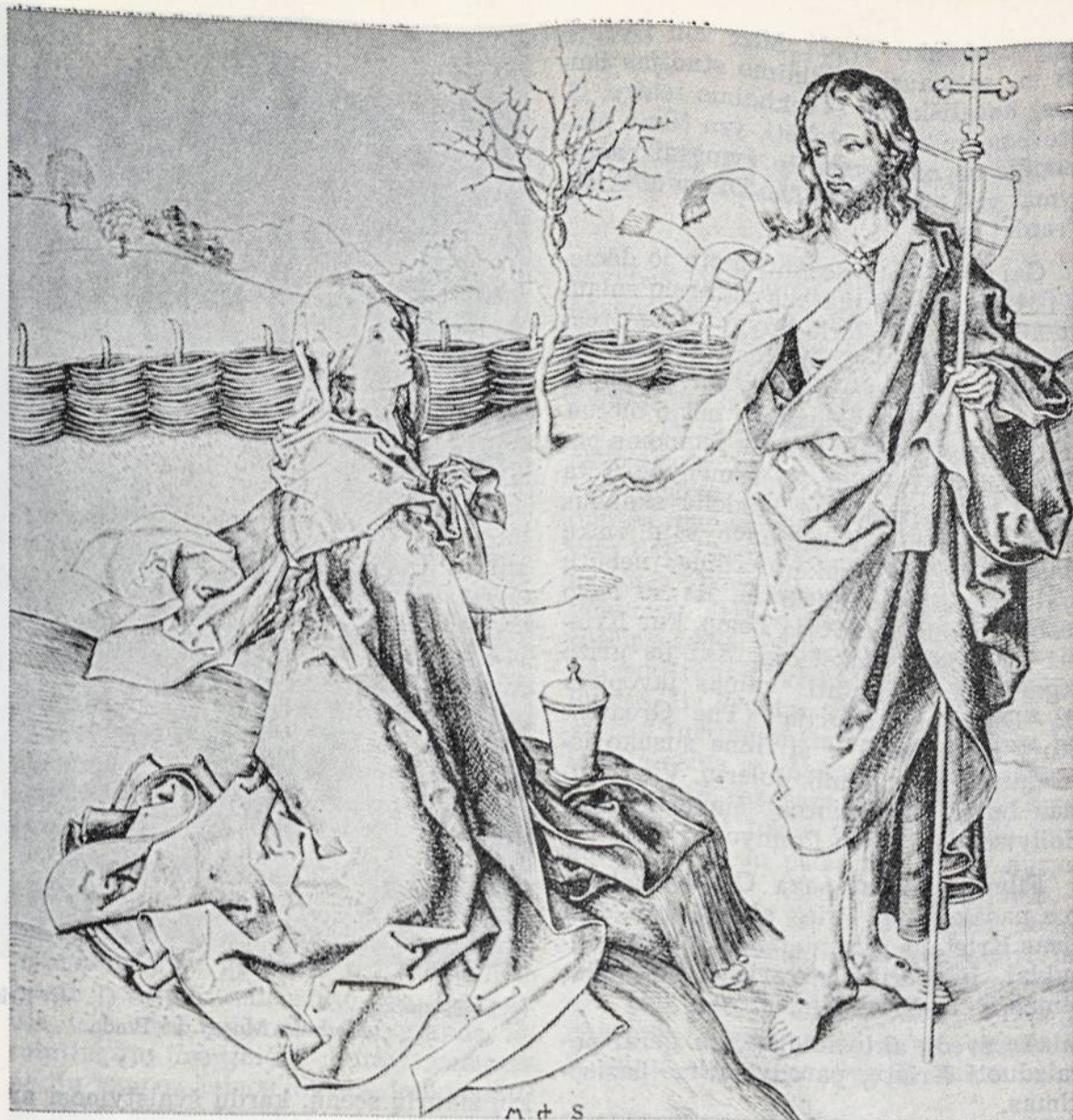
Martin Sshongauer — Kristus pasirodo Magdalenai.