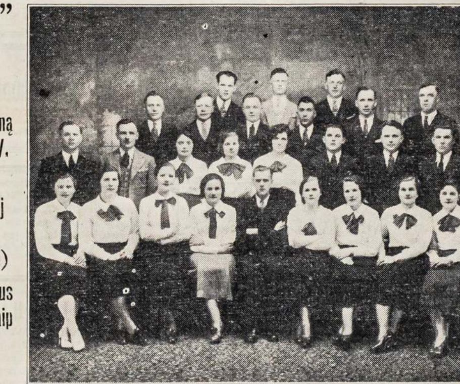
Montreale Lietuvių Jaunimo Choras