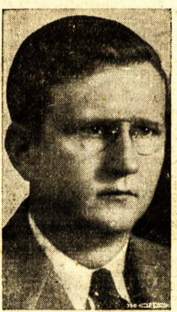
KOMUNISTŲ PARTIJA SAUKIA VISUOMENĖ KOVON

Išgalvojo Grumojančius Laiškus ir Sako, Kad Tuos Laiškus Siuntinėja Komunistai