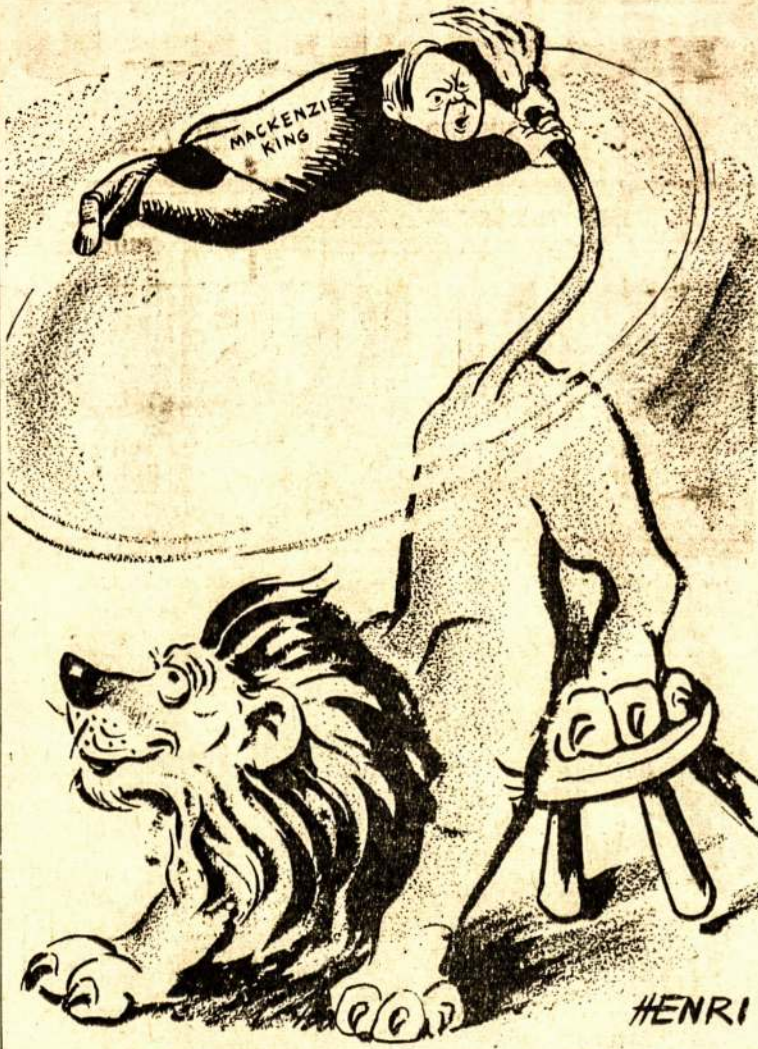
Siame paveiksle vaizduojamas Anglijos imperializmas ir Kanados valdžia, kuri tvirtai laikosi Anglijos imperializmo uodegos.

Kas juokingiausia, tai kad fašistai tą žmonių gyvenimo kas-dieninį jausmą nori paversti partijų jausmu. Girdi, partijos, opo-zicijos save tikslams naudoja socialio teisingumo siekius. Pas juos ne socialiai reikalai kuria partijas, bet partijos socialius rei-kalus. Jei partijos nieko bendro neturi su visuomenės sluogsniais, tai kodel gi fašistai neuždaro savo partijos. Juk ji tiek pat gali būti nereikalinga, kaip ir kitos, kurių fašistai neapkenčia.