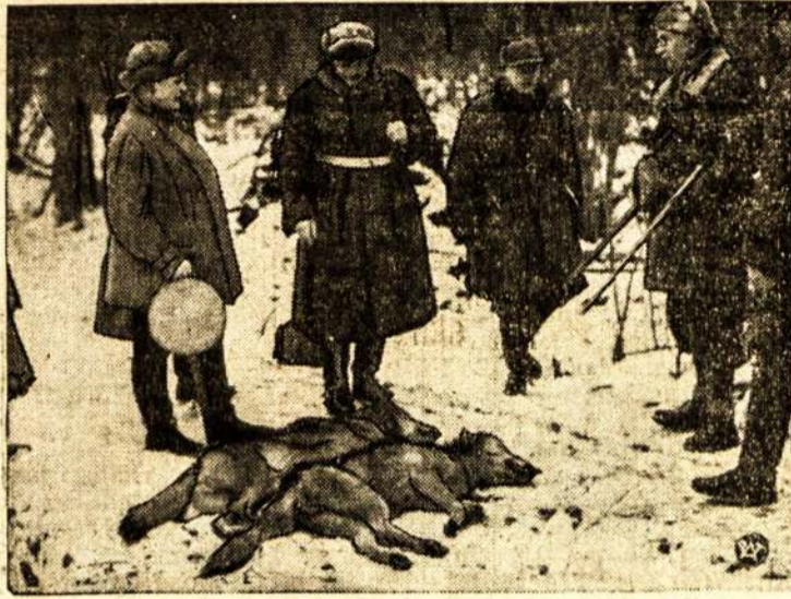
Vokietijos "ekonomijos" ministeris Goeringas medžioja Lenkijoj ir gerinasi prie Lenkijos šlėktų, kad gauti paramą prieš Lietuvą ir Sovietų Sąjungą.