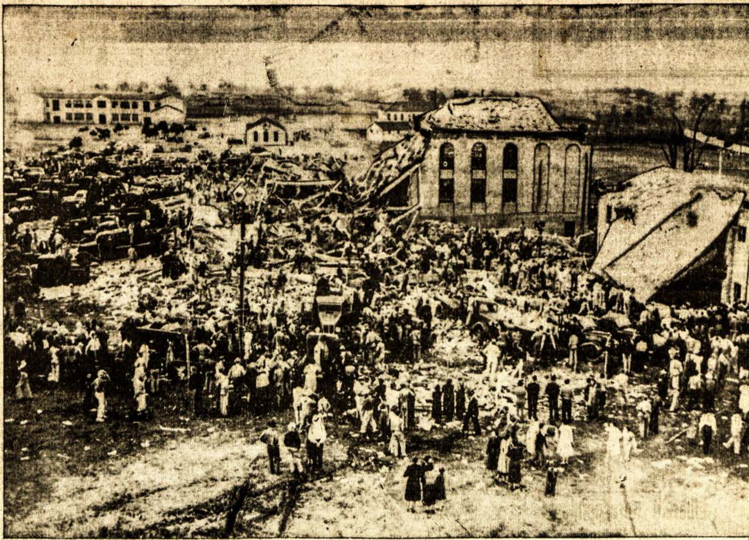
Čia matyti vaizdas New London mokyklos po eksplozijos, per kurią žuvo 455 vaikai.