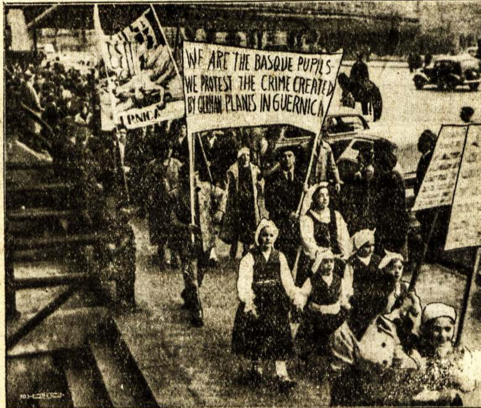
Demonstracija New Yorke prie Vokietijos konsulato, reiškianti protestą prieš Vokietijos barbarizmą Ispanijoj. Demonstrantai, apsirėngę baskiečių tautiniais drabužiais, protestuoja prieš Guernikos gyventojų išduymą. Jų tarpe yra ir baskiečių emigrantų. Šiomis dienomis Hitleris vėl papildė baurą žmogžudystę bombarduodamas Almeriją.