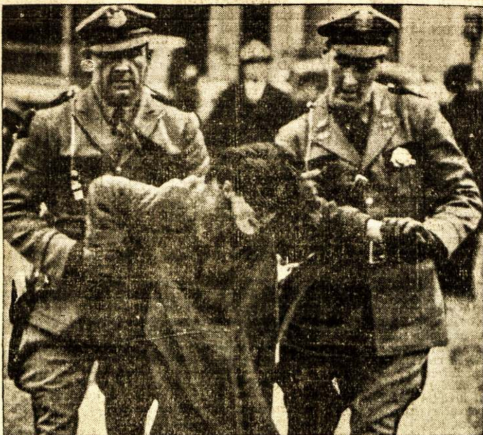
Nors sulyg įstatymų šie Maine valstijos policijantai turi ant vieskelių, tačiau jie buvo pašaukti lauzyti Auburn-streiką. Čia matyti, kaip jie velkasi streikiere. Streikaliai algų, nes moterims mokėjo tik po $8.00 įsavite, o rint teror, kompanija buvo priversta taikytis su unija.

Orkestrui vadovavo ir priruosti programą padėjo 7 profesionalai orkestrų mokytojai. Ką kodel lietuvių nedaug dalyvavo šiam koncerte, mano nuomone, vertingiausiame koncerte, buvo tik paruošiami. Be ne mažokai interesuojamasi jaunuomenės auklėjimu. Šis koncertas, apart dailinės vertės, dar duoda labai gražų išpūdį. Kuomet matai 300 darbininkų vaikų vienam būry taip gražiai pildant programą, rodo, kad darbininkų klasė auklėja savo menininkus jaunuolius nepriklausomai nuo buržuazijos. Dalyvavęs