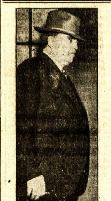
J. L. Lewis—C.I.O. pirmininkas.

OTTAWA, Geg. 31.—Kadangi Hepburnas buvo atsikvietęs į Torontą kelis desėtkus karališkos policijos vyrų, dabar federalė valdžia reikalauja sumokėti $2,800. Bet Hepburnas sako, kad nemokėsias, nes ty policijantų jis negalėjęs naudoti laike Ottawos streiko delto, kad federalė valdžia uždraudus. Federalė valdžia Ontarijos provinciją delto trauksianti teisman.