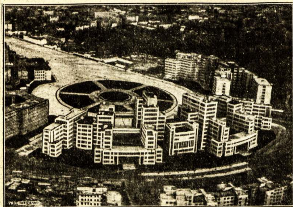
Passivys New Yorką—Sovietų Sąjunga nepaprastu spartumu budavoja puikius ir aukštus budinkus, kurie lyginasi su New Yorko dangaraižiais ir kitų miestų gražiausiais budinkais. Cia matyti Dzeržinskio aikštė Karkovo mieste, Ukrainoje. Tai aukščiausi budinkai visoje Europoje.