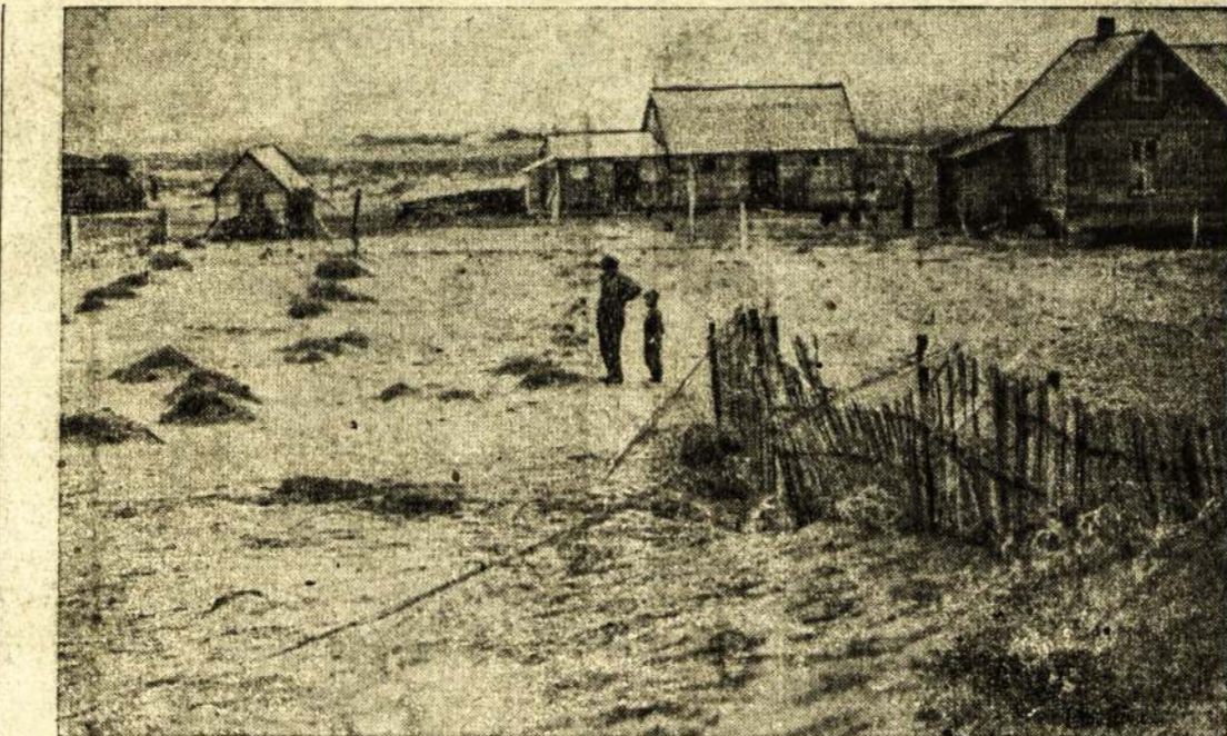
Scena Vakarų Kanadoj.—Kada tai buvusi graži ir pelninga farma, o dabar baigiama apnešti žemėmis. Tūkstančiai fermerių palieka savo ūkius ir bėga į kitas provincijas.

Južintai.—Rugpjūčio 29 dieną buvo švento Baltramiejaus atšaidai. Južintiškiiai—vaišingai žmonės, prieš kiekvienus atšaidus prisigamina įvairios „krūminės“ ir „samarlako“, ir par-