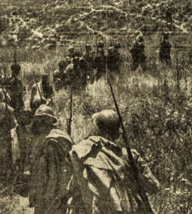
Karo scenos:—Kairėj (viršuj)—chiniečių namų griuvėsiai. Japonijos orlaiviai tūkstančius chinų namų sugriovė bebombarduodami chinijos miestus. Dešinėj—Chinijos kareiviai su kulkosvaizdžiu, pasirengę ginti šalį. Apačioj—Ispanijos liaudies kareiviai eina į ataką Aragon fronte.