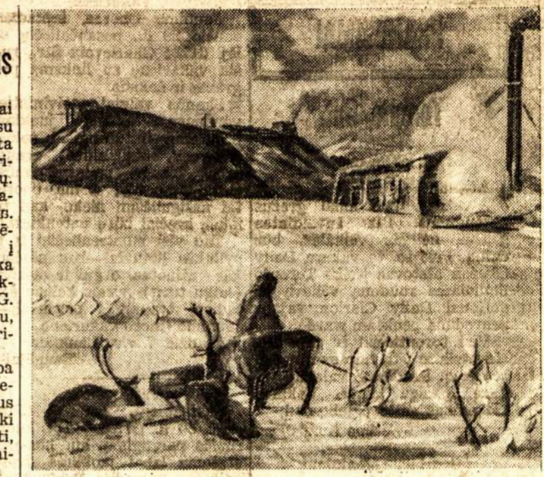
Anglių kasykla tolmoj Sovietų Sąjungos šiaurėj. Per peraitus anglų.