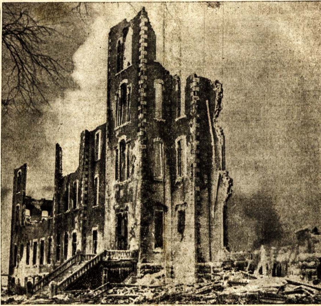
Tai liekanos Sacred Heart kolidžiaus Hyacinthe miestelyje, po gaisro, kuris surijo 46 studentus ir vienolius. Ape 20 laivo buvo ištraukta, o likusių nedžiaus Hyacinthe miestelyje, po gaisro, kuris surijo 46 studentus ir vienolius. Dauguma studentų buvo tarp 15-20 metų amžiaus. Buvo ir jaunesniū. Tai baltis tragedija. Vieni tėvai neteko visų trijų vaikų.