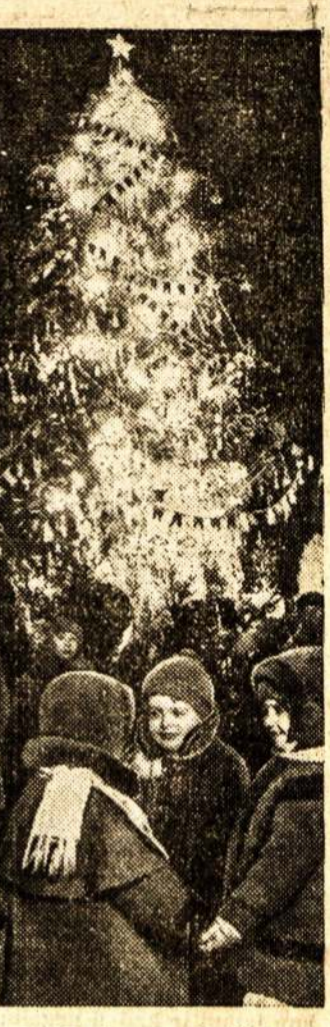
Smagūs Maskvos vaikučiai prie Naujų Metų eglutės.

WASHINGTON.—Gautas iš Amerikos ambasados Paryžjyje pranešimas apie fašistų užgrobia Jungtinių Valstijų prekiniu laivo Nantucket Chief prie Barcelonos uosto. Valstybės sekretorius Hull daro tyrinėjimą.