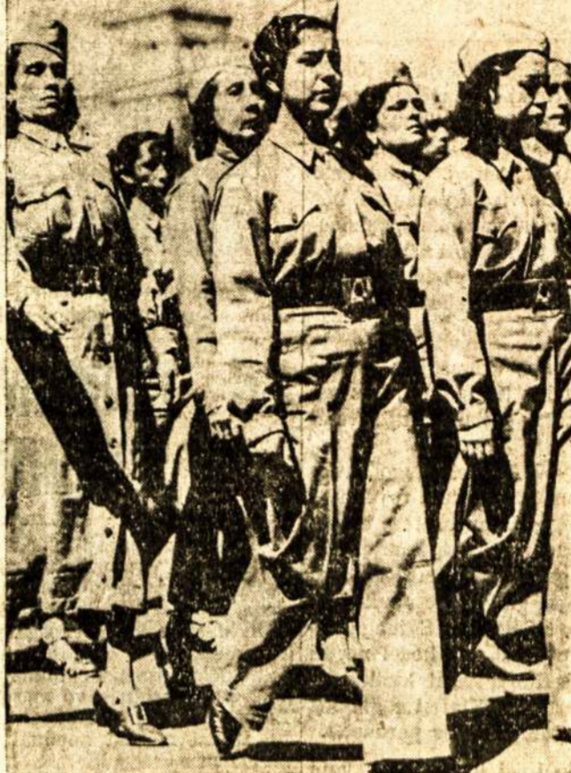
Meksikietės milicijos drabužiuose maršuoja gatvėmis Pirmą Geguzės. Jos priklauso prie Meksikos darbininkų milicijos gynimui demokratijos.