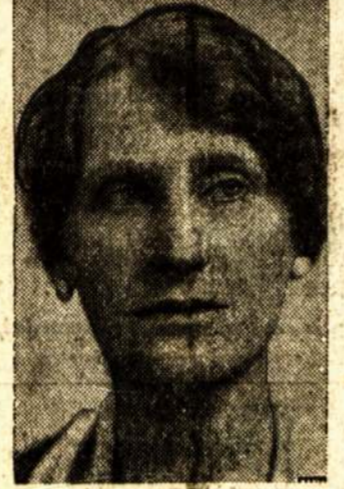
Mrs. Nelle Taylor Ross, priziterėtoja Dėdės Samo aukso, kuris siekia $12,780,000,000.