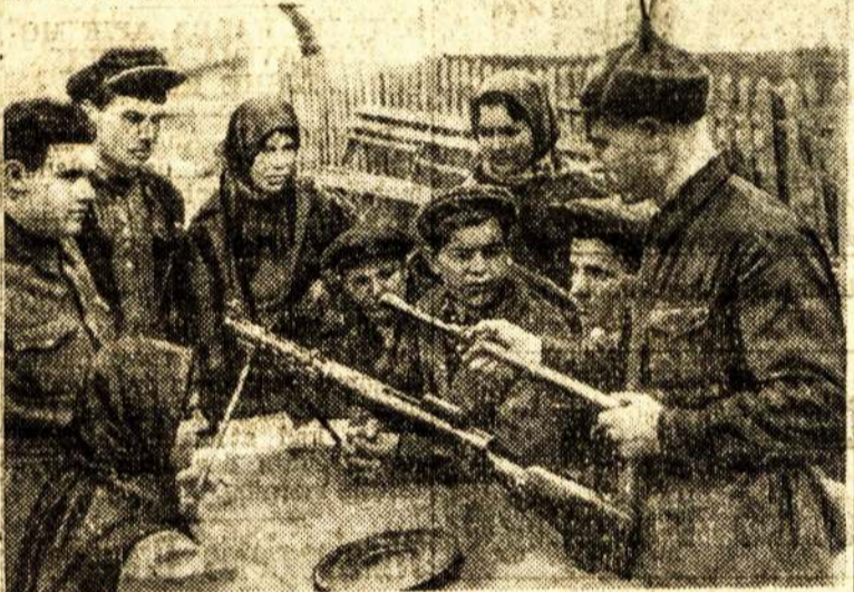
Raudonarmiečiai mokina kolektyviečius šaudyti, kad reikalui iš- tiklus mokėtų ginti šalį.