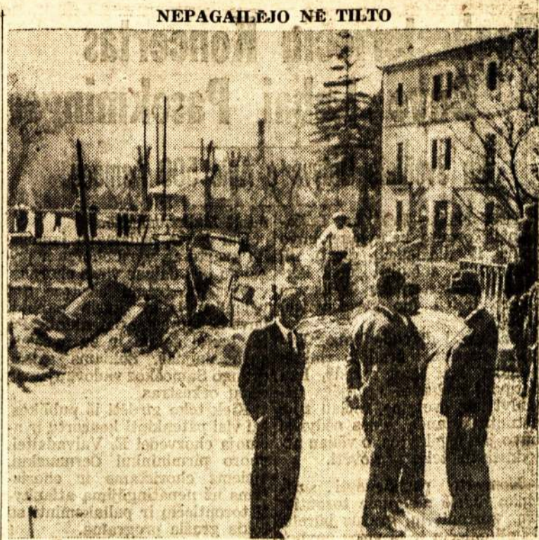
Ne visiems galima, kad žmonės terorizuoja. Štai ant Francijos rubežiaus buvo susprogdintas tiltas, kad užkirsti lojalistų bėgimui į Franciją nuo Franko gaujų.

Po sukilimo nuraminimo, Bar- celona vėl susitvarkė—išnyko maišų pyllimai ir medinės barj- kados, susisiekimas ir fabrikai vėl pradėjo normalų darbą.