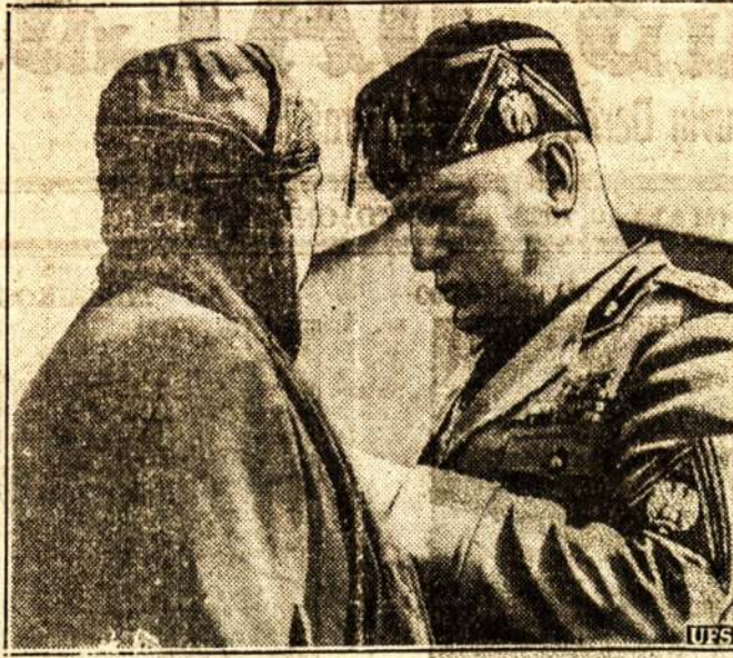
Benito Musolinis apdovanoja motiną, kurios sūnus žuvo Ispanijoje, bekovodamas už fašizmo reikalus.