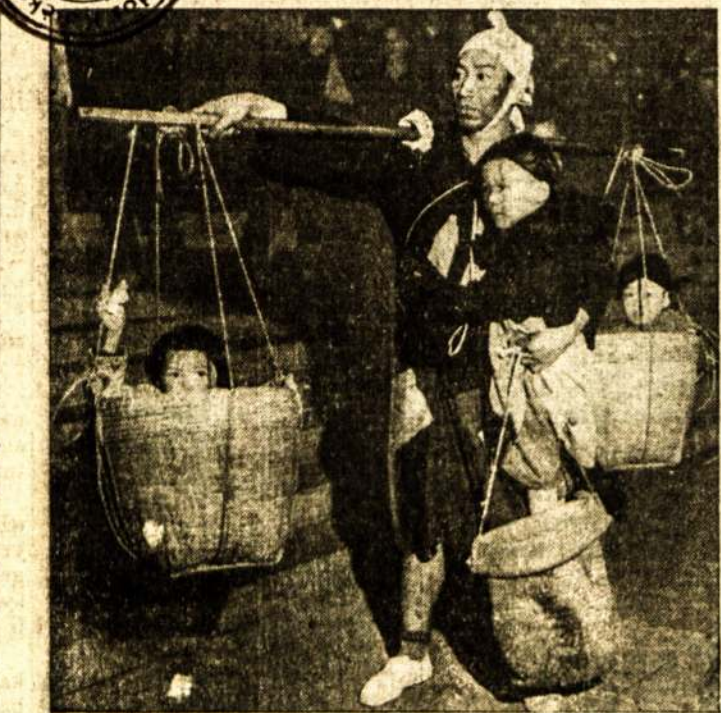
VAIZDUOJA LIAUDIŠKŲ LIKIMŲ

Naziai reikalauja, kad apie Hitlerį apdainavimas būtų kuogreičiausia sulaikytas ir visi "kaltininkai" būtų nubausti.