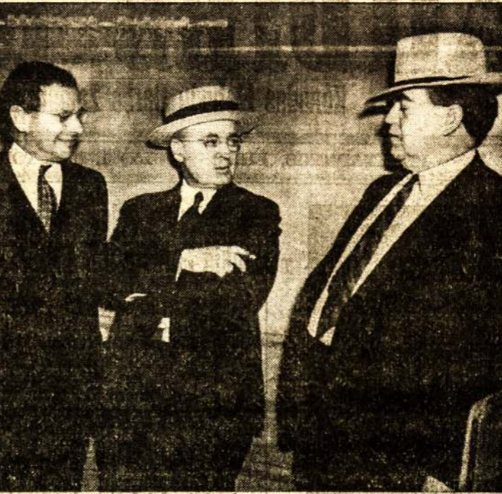
C.I.O. VADAI IR GUBERNATORIUS

Kai tu kritai kovoj garbingoj, Ilgai visi tavęs gedės. Nes tu kritai kovoj del laisvės, Del brolių laisvės, pergalės.