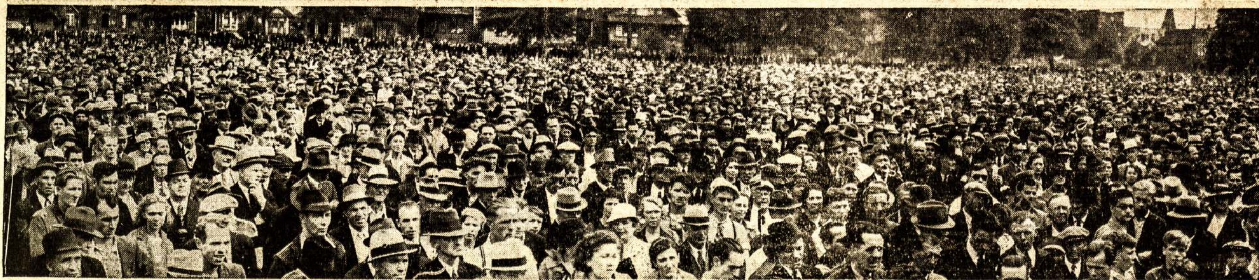
Dalis masinio protesto mitingo Vancouver mieste, kuriame dalyvavo 15,000 žmonių, kad išreikšti protestą prieš politijos brutalumą išmetant bedarbius iš pašto namo, nes daug bedarbių buvo sunkiai sužeisti.