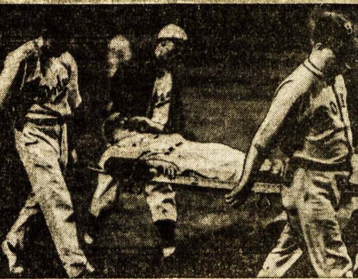
KARTAIS SPORTAS VIRSTA "KARU" Paveiksle matome ant neštuvų nešančią vieną iš lošėjų, sunkiai sužeistą, kuomet kitas lošėjas uždavė jam per koją su "pagaliu." Tas įvyko Brooklyne, laike rungtynių tarp Cincinnati Reds ir Dodgers.