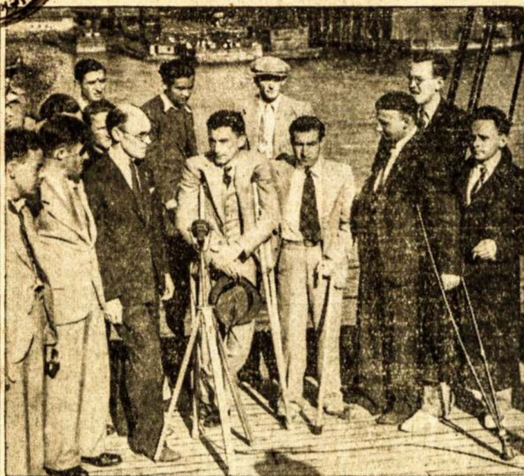
SUZEISTIEJI AMERIKIECIAI GRĮŽTA IS ISPANIJOS Grupė Abraham-Lincolno Brigados savanorių grįžta iš Ispanijos. Ant laivo S. S. Prez. Harding. Tai didvyriai, kurie Ispanijai atidavė savo sveikatą ir kūno dalis, kad išgelbėti Ispaniją nuo plėšiko Franko ir jo užsieninių laisvės vagių, talkininkų.