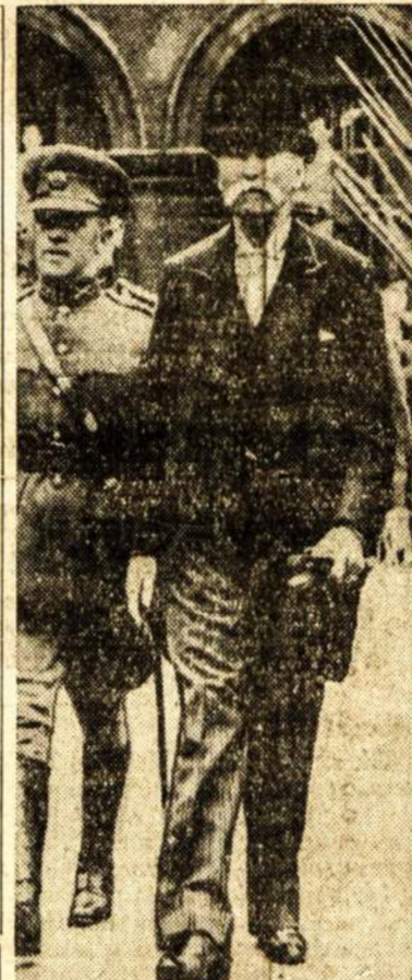
Pirmas Airijos Prezidentas Dr. DOUGLAS HYDE, 78 metų gaelis kalbos žinovas, poetas ir rašytojas, stebi garbės sargybą atvykęs į Dublin Castle. Daktaras Hyde buvo neseniai išrinktas pirmu Airijos (Irlandijos) prezidentu, po naujos konstitucijos. Jis čia atvykęs pradėti savo naujas pareigas.

Prie Teruel-Sagunto vieškelio, 40 mylių nuo Sagunto, fašistai giriiasi užimti Albentos, San Augustin, Barracas ir Pina mieste-