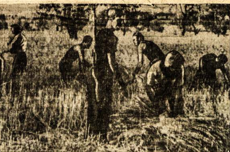
KARO SUDRASKYTOJ ISPANIJOJ. Lojalistai kariai mūsų pertraukų laiku piauna ir renka kviečius, Teruel apylinkėj, kur ėjo baisyš mūšiai. Civilliai žmonės pabėgė iš tos apylinkės, tai kareiviai apsirūpina atelamčios žiemos duona.