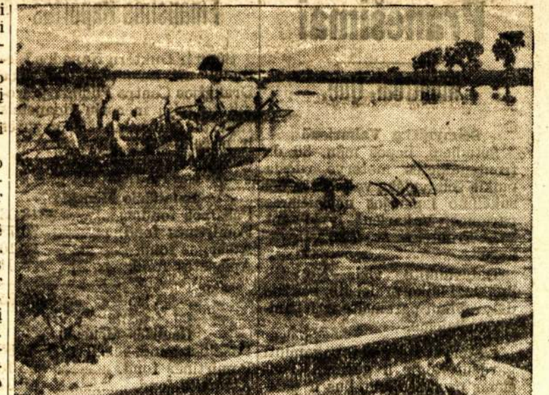
JAPONAI VEDA KOVĄ PRIES GELTONĄJĄ UPĘ Kada kinai suardė užtvankas, japonai atsirado tokioje padėtyje, kaip kad parodoma paveiksle. Potvynis užėmė didelę dalį Kinijos. Tuo būdu kinai sustabdė juos šioje apylinkėje prie Kaifeng.

Jis nuplaukia 47 mylias į valandą. Ant jo yra 4 5-kių colių kanuolės ir 4 torpėdų tūtos. Tai greičiausias Suvienytų Valstijų laivyno naikintuvas McCall.