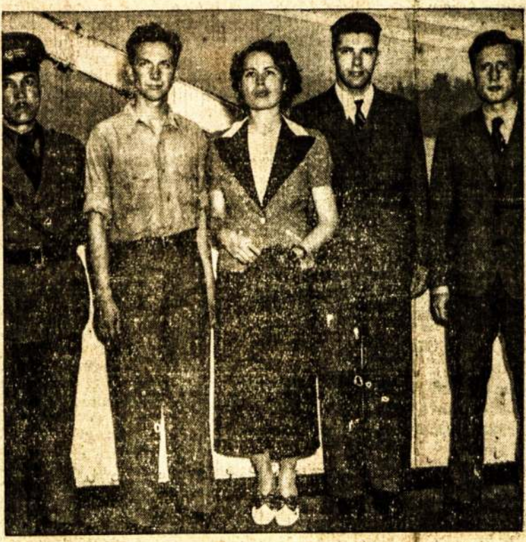
GRĮŽTA SUTEIKĖ PAGELBĄ ISPANIJOS LOJALISTAMS

Rajono komitetui ir bendrai visiems montrealiečiams ir montrealietėms Liaudies Balsas širdingai ačiūoja už tokią gausią paramą. Dabar lauksime pasekmių iš Liaudies Balso pikniko Toronte, kuris įvyks rugpiūčio 14. Torontiečiai ir apylinkės lietuviai, kiek mums atrodo, neturėtų montrealiečiams pasiduoti, nes būtų negražu pasiduoti. Iš rengėjų teko patirti, kad piknikas bus labai įdomus, nes bus įvairių užsiėmimų ir žaidimų.