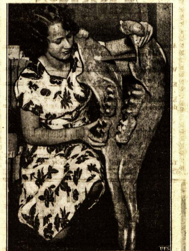
TAI BUVO SKAUSMO, JEI KADA TIE DANTYS SKAUDĖJO Mokslininkai kasmet suranda liekanų gyvulių ar žvėrių, gyvenusių milijonus metų atgal. Milijonai metų atgal ir ant šio kontinento gyveno milžiniški gyvuliai. Paveiklė matome žandikaulį, atrastą Contra Costa apylinkėj, Kalifornijoje, vieno tokio gyvulio. Jį apžiūrį viena studentė iš Kalifornijos universiteto. Jeigu žiam gyvuliui kada nors skaudėjo danti, turėjo būti pėga danti škausmas.

OTTAWA, Ont. —Čia yra manoma, kad naziai dar vis tebedarbuoja, kad nupirktų Anticosti salą švento Lauryno jlanokoj.