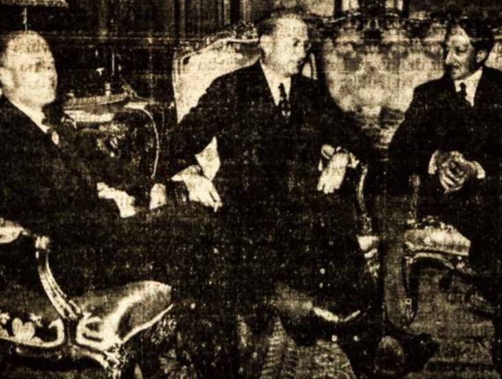
DISKUSUOJA APIE PINIGUS Jungtinių Valstijų išdėstus Morganthau, beatostogaudamas Parizų diskusuoja su Francijos užsieni reikalų ministru Bonnetu (dešinėje) abiejų šalių valiutos klausimą. Kairėje—W. C. Bullitt.