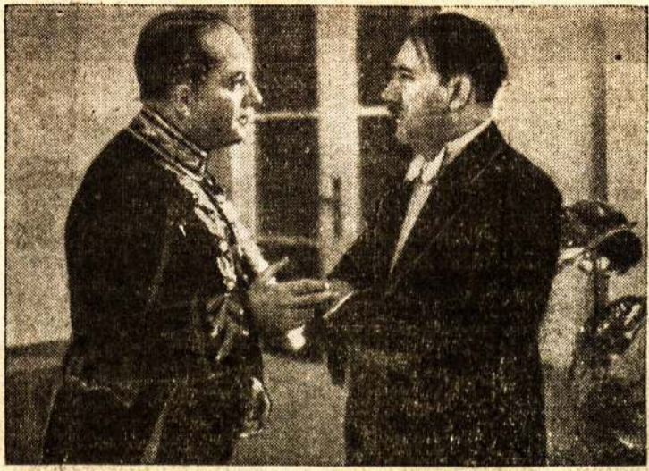
Lenkijos ambasadorius Vokietijai Lipski sveikinasi su Hitleriu. Paskutiniu laiku jis prašė Hitlerį, kad jis reikalautų apsisprendimo teisių ir lenkų mažumai Čekoslovakijoje. Kaip atrodo, tai Lenkija nusitarus eiti kartu su Vokietija.

Šioj, Pasauliui Tragiškoj Valandoj, Kapitalistinėj Bei Provokatorių Spauda Mėgina Žinias Paduoti Taip, Kad Jos Išėtu Tūkais Nenaudai. Teisingas Žinias Paduoda Tik Tikrai Progresyviska Spauda. Platinkite Ją!