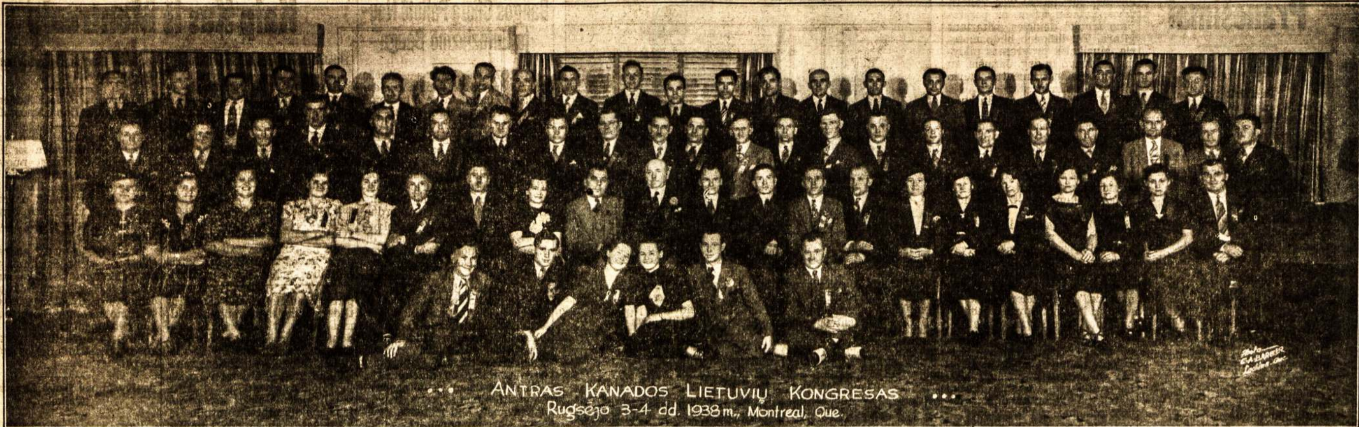
ANTRAS KANADOS LIETUVIŲ KONGRESAS Rugsėjo 3-4 dd. 1938 m., Montreal, Que.