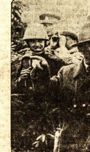
"Ar Mes Išlaikysim Hitlerį?" — Čekoslovakijos prezidentas Benešas (su skribele), generalas Kreici, štabo viršininkas, ir kiti karininkai nufotografuoti laike armijos manevrų. Tėmydami manevrus veikiausiai jie nuolatos galvojo "Ar mes išlaikysime Hitlerį?" Generalas Kreici paskirtas armijos vadu.