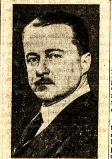
ALFRED DUFF COOPER, pirmas Anglijos admiraliteto lordas, kurs rezignavo iš tos vietos protestuodamas prieš išdavišką Čemberleno politiką, pardavusią Čekoslovakiją Hitleriui.