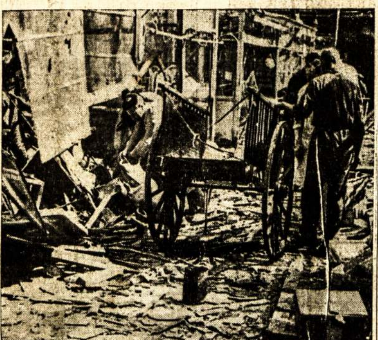
Barcelonos darbininkai verčia grūvėsius ieškodami lavonų, kuriuos palaidoja grūvėsiuose fašistų bomberiai. Bombardavimai atliekami veik kas dieną.