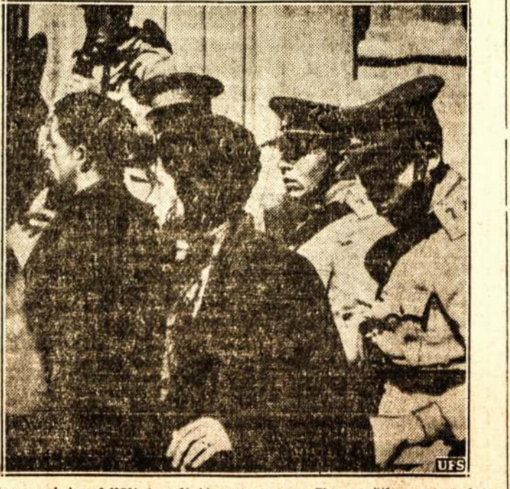
Čilijos naziai sukiličiai policijos nagauso. Jie neužlgo po nufoto- grafavimo Santiago mieste buvo sušaudyti.