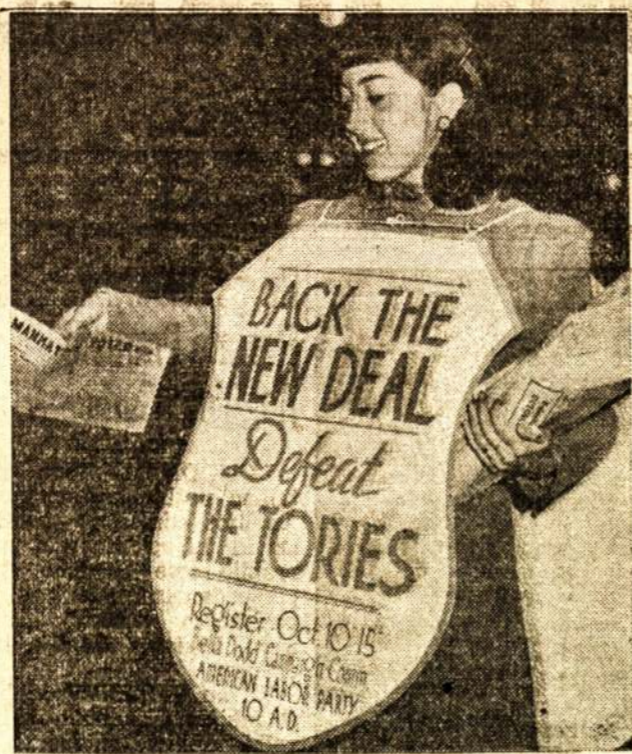
Politinės kovos Suvienytose Valstijose paskutiniu laiku žymiai pagyvėjo. Ypatinai sudužo pažangūs žmonės, kad neįsagalėtų reakcija. Čia matome New Yorko studentę su plakatu, šaukiančiu registruoti Amerikos Darbo Partiją.

Kova už didesnę Kanados apvienijimą yra labai svarbi kiekvienam Kanados darbo žmogui. Tai kova už geresnę žmonių gyvenimą, už progresą. Štai kodėl Hepburnas ir Duplessis, kaip didžiojo kapitalo tarnai, taip priėmėsi pakeitimui Kanados konstitucijos tokia kryptimi, kad būtų galima įvesti socialę apdraudą įstatymus ir apibendrinti darbo sąlygas visose provincijose.