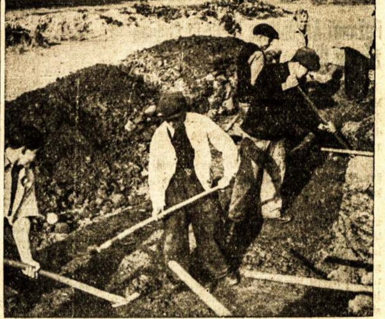
Ir Čekoslovakija įveda verstino darbo kempes. Čia matom Pragos bedarbius, paimtus prie verstino darbo, kasant ravus del pamatų Masariko namui, kuriame bus laikomi seno amžiaus pensininkai.

OSLO, Norvegija. — Vietos fotografas savo studijon sukietęs 30 svečių pasilinksminti, žuvo pats ir visi svečiai, kuomet iš nežinomos priežasties studijos išsivystė gaisras.