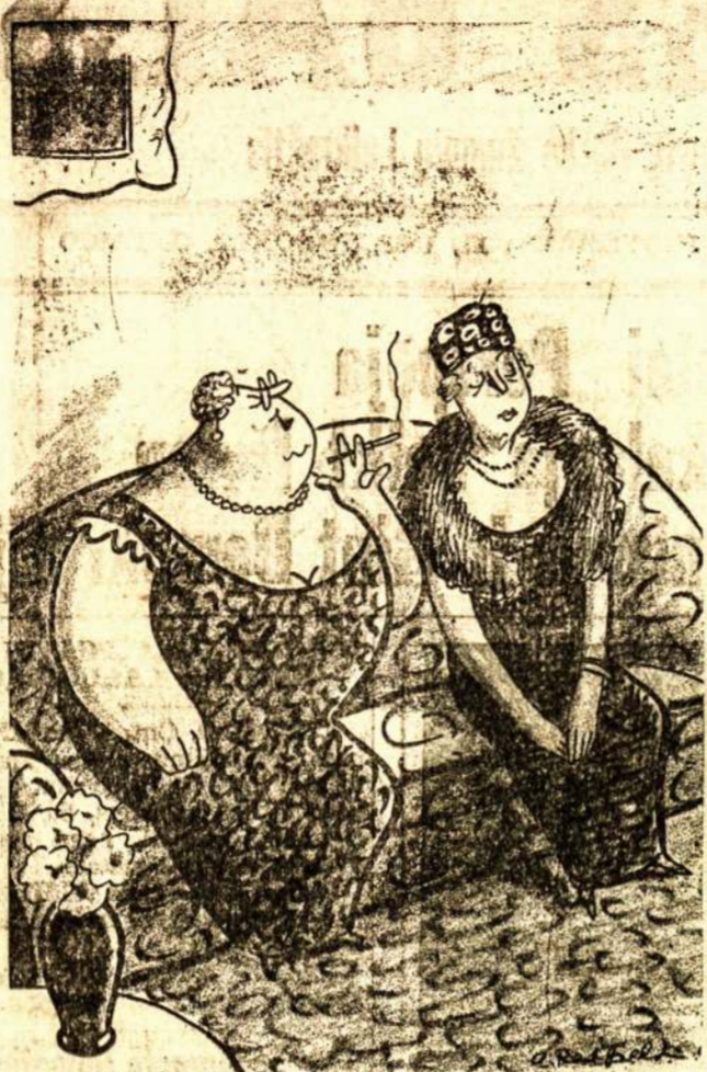
"Nenusimink, tėvas pradžia gyvenimo duos $150,000." "Ilgai gi to užteks?"

"Vienok reikia pasakyti, kad praeity pas mus tokio aiškaus supratimo nebuvo. Ar tai dėl stokos susipažinimo su teise, ar tai dėl kitų priežasčių buvo ne syki prasilenkta su teisės ar įstatymo numatytomis trustistų pareigomis. Kaip trustistams, SLA virši- ninkams nevalia skolintis Susivienijimo pinigų savo namams ar savo biznui. Vienok mūsų viršininkai pasilimdavo iš Susivienijimo izdo ne vieną paskolą sau, savo giminėms ar mylimiems. Kaip trustistams, SLA viršininkams nevalia senų namų pertaisynti ir naujus spekuliacijos tikslais. Vienok vieno namo 'remontui' buvo išleista su viršum $43,000. Kaip trustistams, SLA viršininkams nevalia vartoti Susivienijimo pinigų jokiai spekuliacijai. Vienok praeity buvo sukista daugiau kaip $200,000 Susivienijimo pinigų į tokus bondus, už kurių 'pardavimą' buvo duodama 10 ir dau- giau kaip 10 nuosimčių komisio—iš pat pirmos dienos su didele skriauda Susivienijimui."