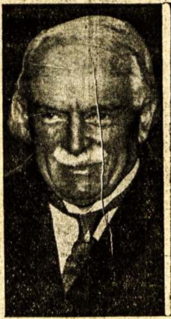
David Lloyd George, karo laiku buvęs Anglijos premjeras, kurs dabar smarkiai kritikuoja Čemberleno politiką.

Tūlam laikui paslėpęs savo ir liginio pavardę chirurgas teigia, kad buvusio neregio regėjimas bus ant tiek išvystytas, kad jo akys bus tinkamos net ir skaityti.