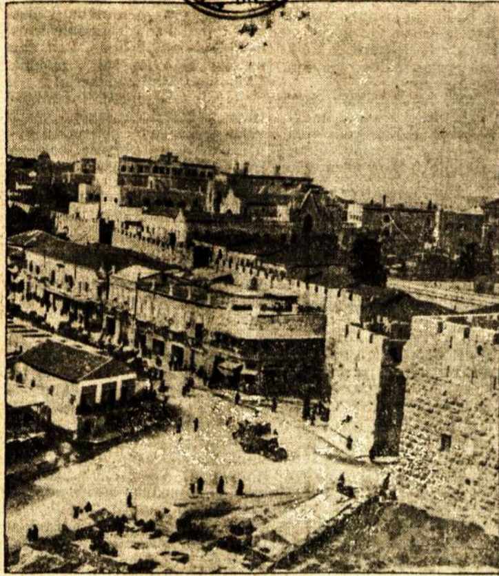
Vienas iš Palestinos miestų—Jaffa miestas, kur įvyko dideli arabų, žydų ir anglių susikirtimai, privertę Anglijos imperializmą atsisakyti Palestinos padalinimo politikos. Dabar angliai praneša, kad neužilgo šauks žydų-arabų konferenciją Londone.