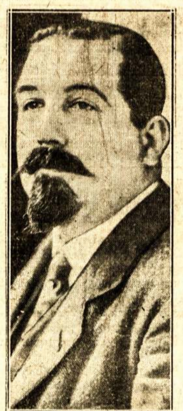
Generalis Francijos Darbininkų Konfederacijos prezidentas Johauz, kurio vadovybėje įvyko generalis streikas. Daladje grumojo jam areštą.

ROMA. — Fašistiniam Italijos atstovų butui praėitą trečiadienį paleidus šūkį, kad Italija privalo užimti Tunisą, Korsiką, Savoją ir Nicę, tą nuomonę pradėjo kartoti ir fašistiniais laikraščiais. Musolinio laikraštis Giornale D'Italia pareiškė, kad Italija yra pasirengus maršuoti ant Francijos, jeigu reikės. Tą patį pareiškė ir Musolinio žento Ciano laikraštis Telegrafo. Be to, pridėjo, kad Italija reikalauja ir Džibouti uosto.