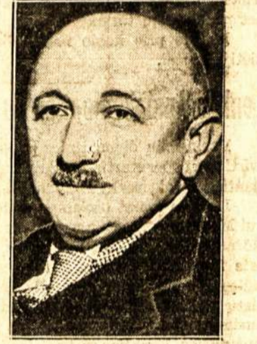
Naujas Cekoslovakijos premjeras Dr. Beran.

Generolas Frankas ir vėl pasiskelbė, kad greitai užkariaus Ispaniją, vesiąs agresyvią politiką, nubausiąs "kaltininkus", o kitiems dovanosius. Girė, valdžios vadai "išdušė" pusę milijono ispanų, o labiausia kalti, kam jie veda prieš jį pasipriešinimą.