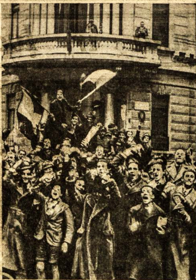
Italai fašistai demonstruoja prie "Popolo D'Italia" ofiso reikalaudami atimti iš Francijos Tunisą, Korsiką, Niciją ir Sevoją.