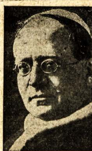
Popiežius Pijus XI, kurs paaukavo $5,000 del Ispanijos civilių žmonių gelbėjimo. Ta popiežiaus auka skaitoma užgyrimu teikimo paramos lojalistų Ispanijai, kur didelė stoka maisto ir drabužių.

ISTANBUL, Turkija. — Juodojo jūroje vakar siautė nepaprastai žiauri audra, kurioje žuvo 22 žmonės. Su nuostolingu audra siautė aršus šaltis ir iškrito daug sniego. Dėlei audros ir sniego daugelyje Turkijos vietų suparalyžiuta komunikacija. Nekurie miesteliai izoluoti nuo