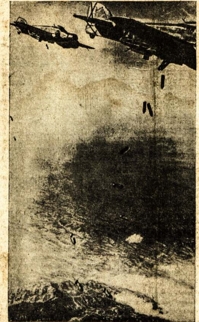
Franko orlaiviai meta bombas ant Barcelonos. Ispanijos kare fašistai atsižymėjo bombardavimu miestų ir žudymu nekaltų civilių.

BERLYNAS. — Lenkijos užsienių reikalų ministeris Bekas penktadienį vyks į Berchtesgadene pasikalbėti su Hitleriu del apsiniaukusių Vokietijos-Lenkijos santykių, kurie liečia Ukrainą, Klaipėdą ir Dancigą.