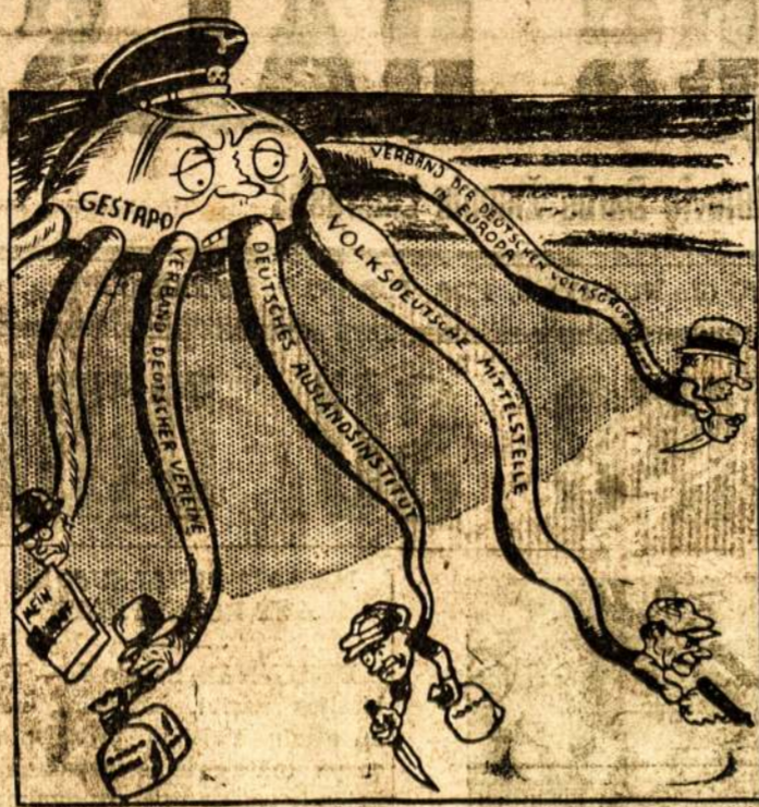
Slaptasis oktopus — Slaptoji Vokietijos nazių policija Gestapo.

Jeigu Lietuvos valdžia galų galė pateks į voldemarininkų rankas, tuomet Lietuva bus jau prapuolus. Tuomet ji greitai bus atsukta prieš Lenkiją ir Sovietų Sąjungą Vokietijos nazių naudai.