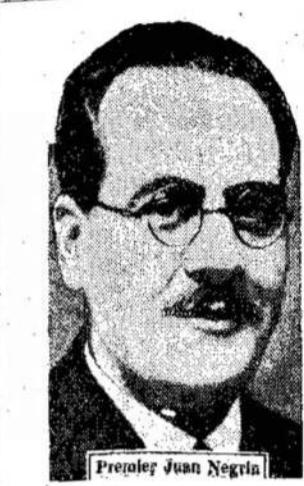
Premier Juan Negrin

LONDONAS. — Anglijos valdžia sako, kad orlaivių gaminiame dabar dalyvauja 2,000 Anglijos firmų, kurios greitai laiku pavys Vokietiją ir karui ištikus pagamins po 3,000 orlaivių kas mėnuo.