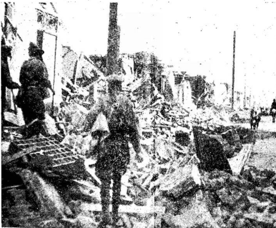
Vaidzas Čillan miesto Čilej po žemės drebėjimo. 40.000 gyventojų mieste liko tik trys pastatai. Visas miestas taip sutarštas, kaip ir šiame paveiksle matomas vaidzas. 40.000 žmonių žuvo. Kiti ir šiandien guli po griūvėsiais.

Tikrintybių tas blokas yra nukreiptas prieš demokratines valstybes ir prieš Sovietų Sąjungą.