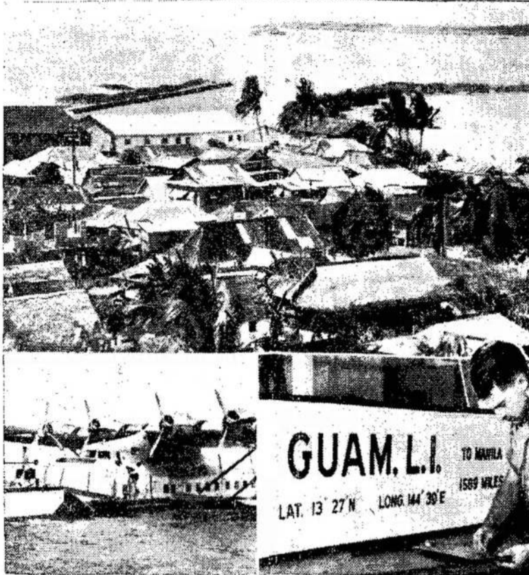
Ši mažą sala vardu Guam pagarsėjo po to, kada SAV nutarė ją fortifikuoti. Iš čia SAV bombardieri gali lengvai pasiekti Japoniją. Japonijos valdžia kelia protestus. Viršuj matosi uostas ir namai. Apačioj, kairėj Pan-American orlaivis šlaipdina keleivius. Dešinėj — iškaba, kviečiantį keleivius į salą.