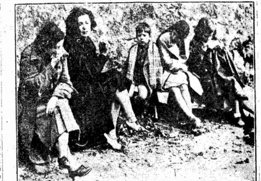
Katalonijos pabėgėliai Francijoj. Negalėdamos užmirsti pergyvenų tų vargų, moterys verkia. Iš kelių dešėtkų tūkstančių pabėgėlių pas Franką išvyksta tik keli šimtai.

Laikė tų užpuolimų 80 japonų pateko į kinų rankas. Taipgi kinai paėmė didelius kiekius ginklų ir amunicijos. Užpuolimai padaryti nakties laiku.