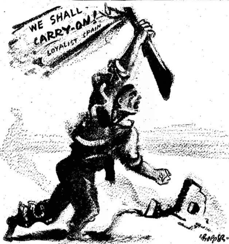
Centralinės Ispanijos liaudis pa siryzus kovoti iki galo

Lietuvą gali išgelbėti tik atsteigimas demokratijos.