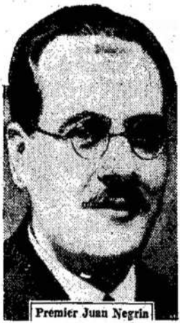
Premier Juan Negrín