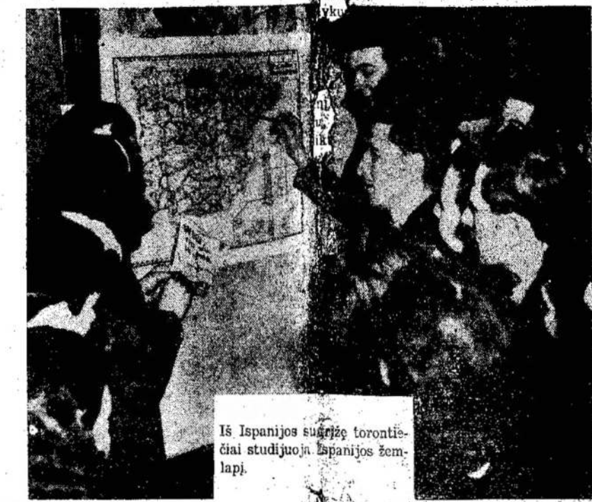
Iš Ispanijos suarižę torontiečiai studijuoja Ispanijos žemėlapi.

Prezidentas Rooseveltas, kurio siūlymą paskirti $5,000,000 kūriniui laivyno bazės Guam saloj, Suvienyty Valstijų Kongresas atmetė. Šiuo kartu prie republikonų prisidėjo ir reakcingieji demokratai. Jie aiškina, kad tą darą nenorėdami užrūstinti Japonijos.