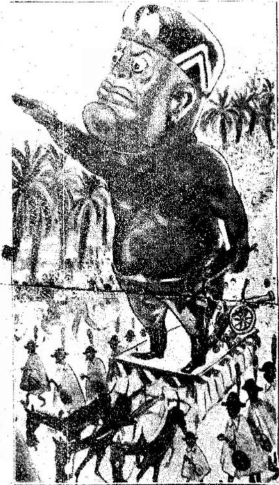
Piešinių parodoj Paryžiuje išstatyti ir šie Hitlerio ir Musolinio atvaizdai. Francūzų spauda bijo šiuos atvaizdus dėti, tačiau Kanasodėjo. Jie buvo įdėti Stare ir darbininkiškuose laikraščiuose.