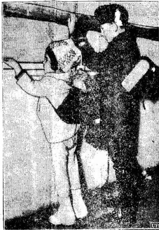
Jauni pagėgeliai nuo Vokietijos nazių režimo, nuo laivo "Manhattan" domisi Laisvės Statula, įplaukanti j New Yorko uostą, supradsdami, kad čia jiems bus laisvas gyvenimas, nors ir svetimoj žemėj.

Apdiskusavę salės statymo klausimą priėmė priėmė priėmė, kad reikia tartis su kitų tautų vietinėmis organizacijomis ir pavieniais progresyviais asmenimis. Išaiškinimui reikalo ir išdirbinimui planų nutarta šaukti tarptautinį susirinkimą. Du draugai išrinkti vietos parinkimui, darbu ir salės statymo pradžimui numatymui. Numatyta šį pavasarį pradėti statyti. Taip pat numatyta salę statyti už miesto ribų, Bronat Wiel kaimelyje, esančiame už mylios nuo Kapuskasingo. Mat Kapuskasingas skaitomas kompanijos miestu. Nežiūrint, kad daug namų pri-