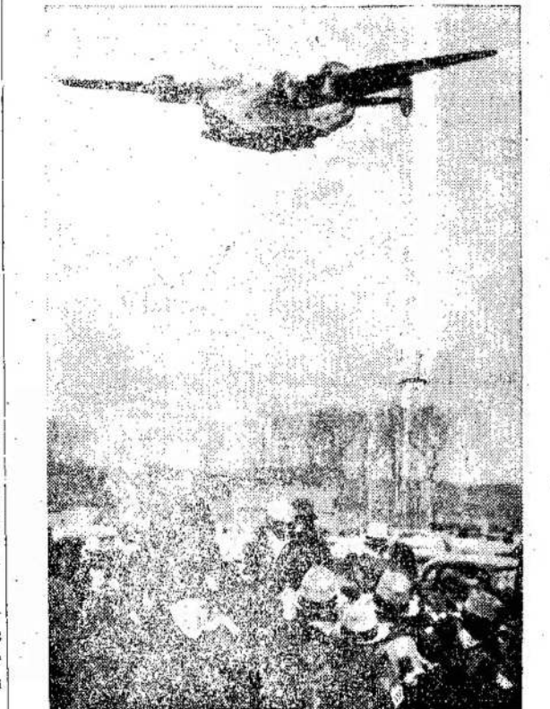
Pan-Amerikos Airways kompanijos orlaivis gigantiškas "Yankee Clipper", matomas virš Baltimorės, Md. Po ilgų mėginimų šis keleivinis orlaivis kitą savaitę pradės reguliarį susisiekimą tarp Amerikos ir Europos.

tai miegojo smuklininko tarnaitė. Miegojo taip kietai, kad negirdėjo nieko, kas dėjosį kituose kambariuose. Serežka jėgęs į kam-bariuką atsargiai ją pažadino.