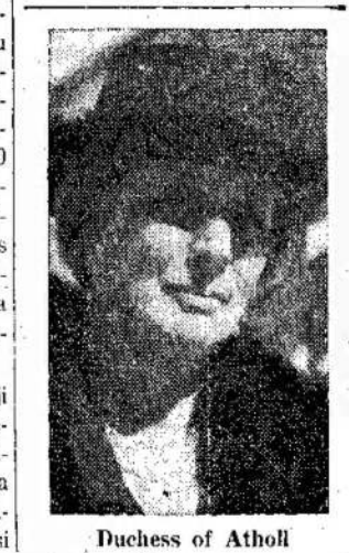
Duchess of Atholl

FRANCIJA Laikė krizių buvo suorganizuotas Moterų Korpusas, kuris