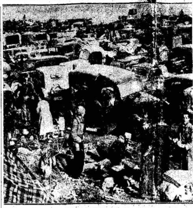
Kada lojalistams prisiejo apleisti Kataloniją, tai jie su savin pamė viską kuom fašistai galėtų pasinaudoti. Čia matome dalį tūkstančių ambulanų ir šiaip valdžios automobilių Katalonijoj, bet dabar ateinančios žinios praneša, kad Francijos valdžia atiduoda visą Ispanijos turtą Francijoj del sukilėlio Franko. Tokią patikavimo politiką lošiant Francija dideliais šuoliais priartina sau galą.

Didesniųjų miestų gyventojai, kaip tai New Yorko, Clevelando, St. Louis ir kitų turi dar didesnes civilines teises, o mažų miestų visiškai blogas. Labai maža civilinių teisių turi Jersey City, Little Rock ir Memphis miestų gyventojai.