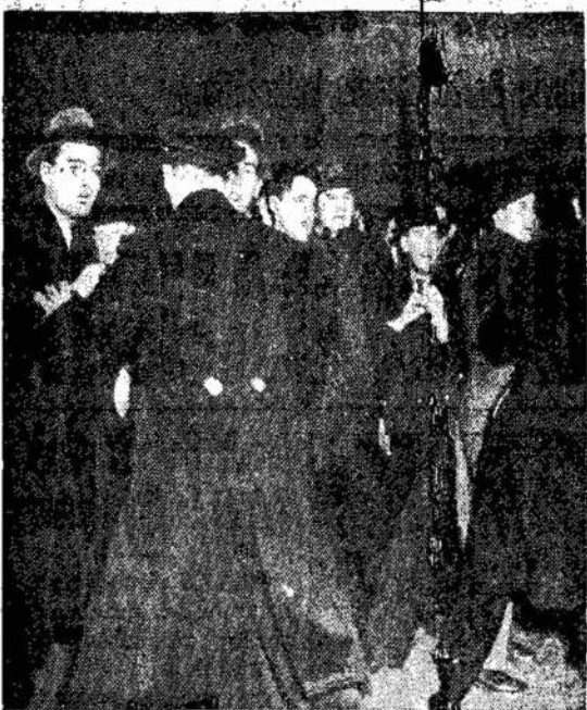
Čia vaizdas anti-fašistų demonstracijos prie Madison Square Gardens, New Yorke, laike masinio nazių susirinkimo, vasario 21-mo. Susirinkimą laikė Amerikos Vokiečių Bundas. Anti-fašistinėje demonstracijoje dalyvavo virš 100.000 žmonių.

Trumpa ateitis parodys, kurios jėgos paims viršų. Bet ir dabar galima pasakyti, kad pavojus iš reakcijos pusės labai didelis. Reakcija ant tiek smarkiai dirba, kad per paskutines kelias savaites ji daug atsiekė. Jos spauda, jos organizacijos, jos kalbėtojai per radio kala ir kala, kad Kanadai pavojus iš kelių pusių. Pirmojo vietoj reakcija mato pavojų komunistuose. Ji nesigali melų ir provokacijų, kad tik išjudinti atsilikusius žmones. Jie patyrė apie tai laike Toronto miesto rinkimų. Su komunistiniu baubu jie išjudino didelį skaičių tokių, kurie pirmiau į politiką visai nesikišo. Paskui seka atakos ant liberalų valdžios. Iš vienos pusės jie liberalus puola, o iš kitos sabotažuoja. Kiekvienam valdžios žygiui jie stvoja kelią.