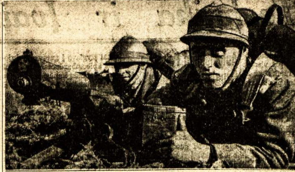
Rumunijos atsakymas į Hitlerio ultimatumą. Viršų: Rumunijos kareiviai ant rubežiaus sargyboje. Dešinė: Rumunijos karalius Karolis apžiūri modernią tanką.

ZEMĖS BANKAS P E R K A KLAIPĖDOJE LENFIKOVES Klaipėda. — Nežiūrint, kad naziai grašina užimti Klaipėdą ir atimti iš lietuvių turtus, Žemės banko Klaipėdos skyrius