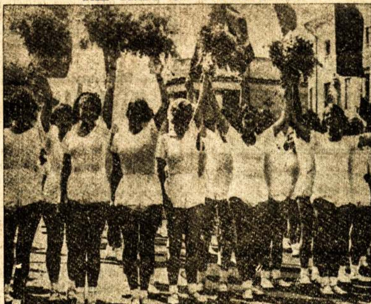
Soviet women athletes at monster Demonstration, last summer: Some of the gymnasts in the annual physical culture parade in Moscow, salute Joseph Stalin in Red Square. Over 35,000 men and women athletes, representing sports clubs in every State in the Union, marched in the procession.