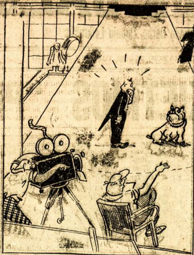
Filmų direktorius: — Dabar tau nebėliko nieko kito daryti, kaip įspirti šuniui ir pasturgali. — Lustig Blatter, Berlyn.

O jeigu kas mano, kad galima ir dabar, lai vykdo. Liaudies Balsas tam nepriešingas. Liaudies Balsas nuo to nenukentės, o priešingai — jam bus dar geriau. Kiekviena lietuvių darbo žmonių pažanga yra Liaudies Balsu džiaugsmu. Jei visos Kanados lietuvių kolonijos turėtų nuosavas sales, būtų lengviau lietuviams organizuotis ir patį Liaudies Balsą išlaikyti. Būtų daug daugiau kultūrinio darbo atliekama. Visa nelaimė tame, kad tų salių niekas taip lengvai neduoda. Kad jas įsigyti, reikalinga daug pavargti ir daug kapitalo įdėti.