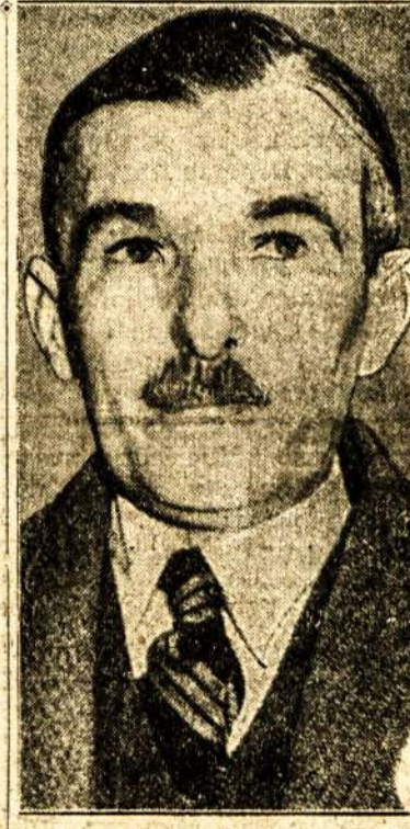
Vladimir S. Hurban, buvęs Čekoslovakijos ambasadorium Vashingtone, kol Čekoslovakija gyvavo. Sako čekai ambasados rūmų naziams neužleis, o pavėsią koku nors čekų klubui.

LONDONAS, Kovo 23. — Anglijos vyriausybės pranešimu, Sovietų Sąjunga sutiko bendrai skelbti keturių jėgų deklaraciją Hitlerio sulaukymui. Tik Lenkija vilkina laiką ir atsakanti nuo suvienyto fronto deklaracijos. Už atsakymą nuo neutralumo Lenkija pirm pasirašymo nori matyti Anglijos, Francijos ir Sovietų Sąjungos pasirašytas galutinas militarines sutartis.