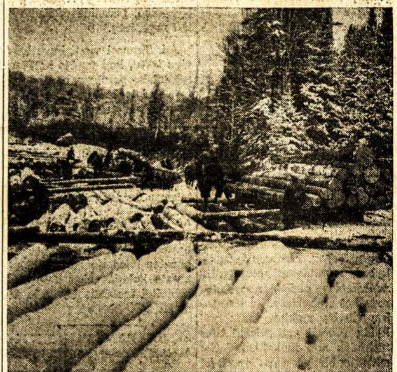
Kanados lumberžekiai verčia į Ottawos upę medžius del lentpiuvių. Miškuose dirba nemažas skaičius ir lietuvių.