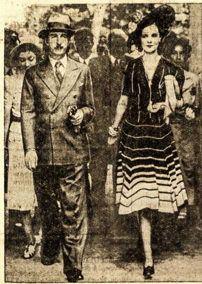
Buvęs Albanijos karalius Zogas ir jo žmona Geraldine dabar ran-

Lankymui laikas: sekmadieniai ir trečiadieniai nuo 3 ligi 4 val. p. p.; pirmadieniai ir penktadieniai po 7 val. vakare. Nuvažiavimui į virš minėtą li-