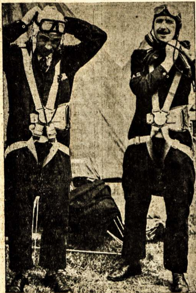
Oxfordo universitetas (Anglijoje) turi lakūnų eskadroną. Paveiksle matome du studentu, kurie dedasi parašiusius besirengdami skraidymo pamokoms.