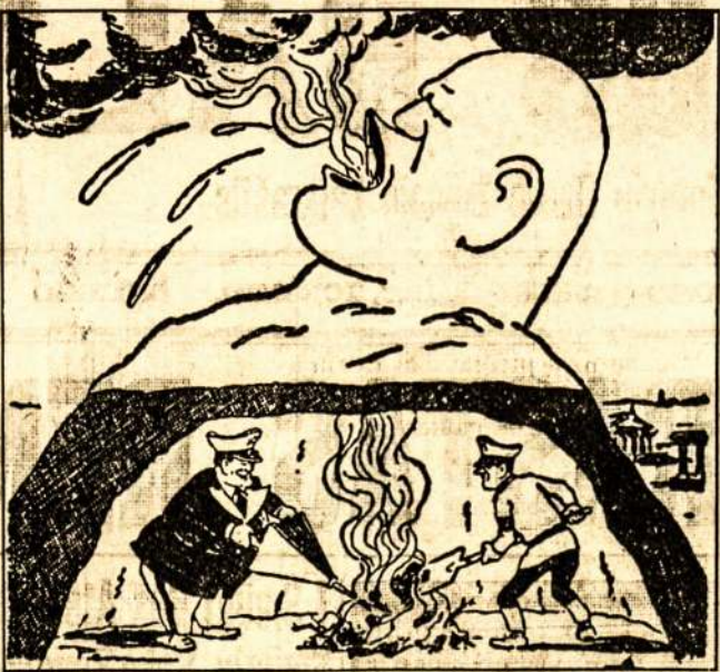
Vezuvijus veržiasi... Vis a Italija dreba.

Liaudies Balsas sveikina draugus už tokį dailų darbą ir linki gero pasisekimo. Taipgi pasižada vesti kampaniją už materialę paramą, taipgi už tai, kad išplėsti iš tų lagerių. Jūs atlikote didelį darbą dėl demokratijos kovodami su Ispanijos liaudies priešais, bet nenustojate dirbti ir uždaryti už spygliuotų vielių. Jūsų darbas ir kova už spygliuotų vielių teikia energijos visiems progresui ir tautos fronto dirbantiesiems lietuviams. Nei vienas geras demokratijos ir tautos mylėtojas negali užmiršti jus, gyvenančius tokiose nepalankiose sąlygose.