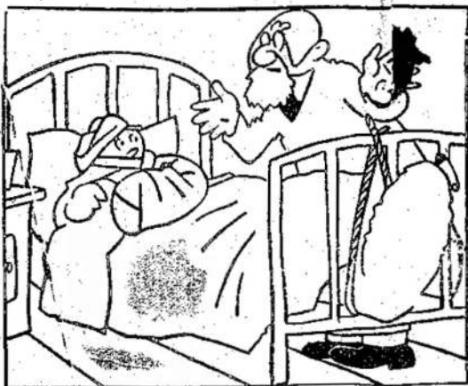
—Bet gi, pone gydytoju, teisė važiuoti buvo mano pusėj. —Taip, bet jo pusėj buvo didelis sunkvežimis.

Toks kandidatų statymas prieš pažangius kandidatus yra labai peiktinas. Kanada labai plati. Tose vietose, kur CCF turi daugiau įtakos, turėtų būti statomi CCF kandidatai.