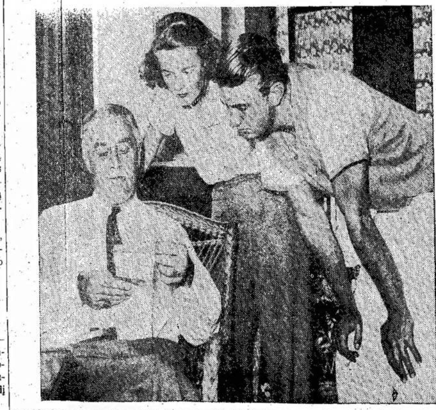
Prezidentas Rooseveltas išsivijo savo sūnui Franklinui D. Rooseveltui, Jr., ir jo žmonai skaito savo laiškus, New Brunswicke. Jis žinias iš laikraščio, matomai, aš žuvauja, nežūrint krizio.

Anglų konsulas atsikreipė į Anglijos valdžią del pagalbos. Daug žmonių turėjo pabėgti iš savo namų, nes vanduo užplūdo.