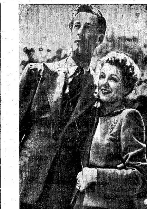
Janet Gaynor, jūdžių artistė, ir Gilbert Adrian, stilistas, po vestuvių, Yumoj, Arizonoj. Pas jū-siskirti ir vėl vestis.

Tam tikrais metų laikotar-piais nekurios didžiosios planetos prisitartina prie mūsų žemės arčiau, negu paprastai, kad jos esti. Šiais metais Marsas buvo arčiausia prisitartinęs prie žemės, negu bet kada. Del to prie-taringi žmonės buvo išsigalvoję įvairių nesąmonių. Dabar prie žemės artinasi dar trys planetos: Jupiteris, Saturnas ir Uranas, kuris savo svoriu yra daug kartų sunkesnis už kitas planetas sudėjus krūvon ir yra didžiausias iš visų planetų.